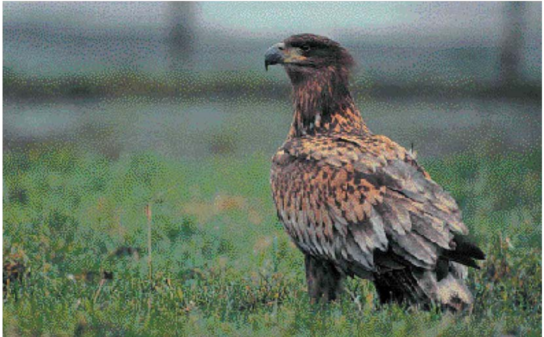
54 Zeearend / White-tailed Eagle Haliaeetus albicilla , Zevergem, Oost-Vlaanderen, december 1998

FRANJEPOTEN TOT GORZEN Langs de Oostdam te Heist zwom van 5 tot 12 december een eerste-winter Rosse Franjepoot Phalaropus fulicaria . Een Middelste Jager Stercorarius pomarinus vloog op 19 december langs Blankenberge, West-Vlaanderen, en op 24 januari verbleef een juveniel exemplaar in de Baai te Heist. Op 6 december vlogen langs Oostende een Grote Jager S skua , een late juveniele Vorkstaartmeeuw Larus sabini en een Kleine Alk Alle alle . In januari volgden nog acht waarnemingen van Grote Jagers. De adulte Grote Burgemeester L hyperboreus van Oostende bleef daar de hele periode present. Nog een adulte zat op 13 december te Harelbeke, West-Vlaanderen; een eerste-winter werd op 1 januari gezien bij Bredene, West-Vlaanderen; op 10 januari was een tweede-winter aanwezig te Koksijde, West-Vlaanderen; en op 18 en 23 januari werden in de Voorhaven te Zeebrugge respectievelijk een adulte en een eerste-winter opgemerkt. Er werd op 8 januari heel wat trek van Zeekoeten Uria aalge of Alken Alca torda opgemerkt, zo vlogen er 146 langs Oostende en 289 langs Nieuwpoort. Op 14 januari vlogen nog eens 188 Zeekoeten langs Nieuwpoort. Op 7 januari passeerde een Kleine Alk langs Oostende. Langs Nieuwpoort werd op 27 december een Papegaaiduiker Fratercula arctica opgemerkt en op 26 januari werden er hier twee gezien. De eerste twee twitchbare Middelste Bonte Spechten Dendrocopos medius voor Vlaanderen waren op 21 december aanwezig te