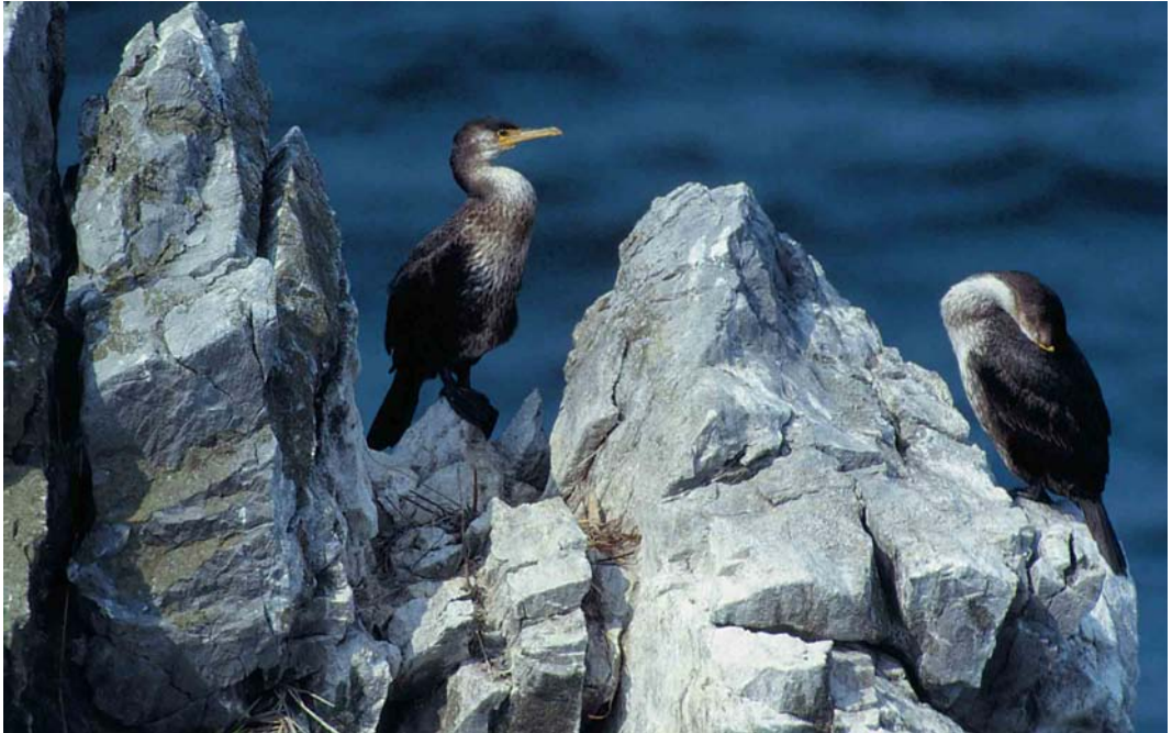
1 Temminck's Cormorants / Japanese Aalscholvers Phalacrocorax capillatus , immatures, Honshu, Japan, June 1998. Bird on left probably second-summer, bird on right first-summer. On second-summer, note yellow tones on bill, yellow facial skin tapering to sharp point behind gape and extending up behind eye. This individual showing especially yellow lores. Second-summer showing narrow white line down centre of otherwise dark belly, pale lower breast and dark upper breast and pale throat