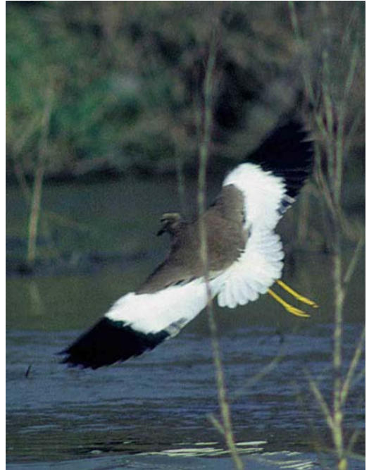
17 Witstaartkievit / White-tailed Lapwing Vanellus leucurus , Assendelft, Noord-Holland, 23 februari 1998 (René Pop) 18 Witstaartkievit / White-tailed Lapwing Vanellus leucurus , Assendelft, Noord-Holland, 23 februari 1998 (Arnoud B van den Berg) 19 Witstaartkievit / White-tailed Lapwing Vanellus leucurus , Assendelft, Noord-Holland, 23 februari 1998 (René Pop)