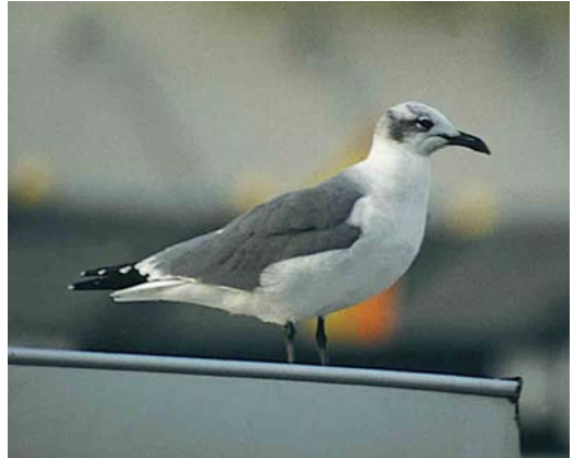
22 Lachmeeuw / Laughing Gull Larus atricilla , adult, Groningen, Groningen, 18 oktober 1997 (Rik Winters)

3 Het laatste punt van twijfel betreft de snavellengte. Op geen van de dia's is de snavellengte goed en profiel te zien. De snavel was ten minste zo lang als bij een Kokmeeuw en zowel volgens de beschrijving als op enkele dia's zichtbaar iets naar beneden gebogen zoals gebruikelijk bij Lachmeeuw. Wellicht had de vogel van Harderwijk een korte snavel, vallend binnen de normale variatie (snavellengte bij Lachmeeuw 32.8-41 mm, bij Kokmeeuw 28.2-36.9, Cramp & Simmons 1983). Een snavel die nauwelijks langer lijkt dan die van Kokmeeuwen hoeft dus niet uitzonderlijk te zijn. Daarnaast is het mogelijk dat geen van de enigszins scherpe dia's de vogel in een zodanige houding toont dat de snavellengte objectief te bepalen is.