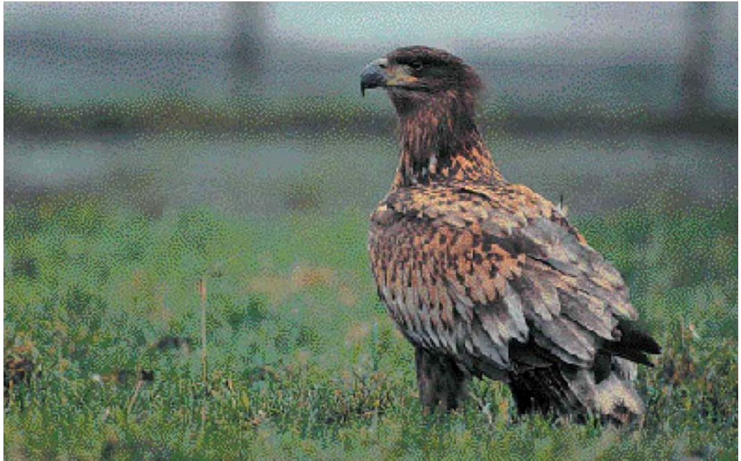
54 Zeearend / White-tailed Eagle Haliaeetus albicilla , Zevergem, Oost-Vlaanderen, december 1998

FRANJEPOTEN TOT GORZEN Langs de Oostdam te Heist zwom van 5 tot 12 december een eerste-winter Rosse Franjepoot Phalaropus fulicaria . Een Middelste Jager Stercorarius pomarinus vloog op 19 december langs Blankenberge, West-Vlaanderen, en op 24 januari verbleef een juveniel exemplaar in de Baai te Heist. Op 6 december vlogen langs Oostende een Grote Jager S skua , een late juveniele Vorkstaartmeeuw Larus sabini en een Kleine Alk Alle alle . In januari volgden nog acht waarnemingen van Grote Jagers. De adulte Grote Burgemeester L hyperboreus van Oostende bleef daar de hele periode present. Nog een adulte zat op 13 december te Harelbeke, West-Vlaanderen; een eerste-winter werd op 1 januari gezien bij Bredene, West-Vlaanderen; op 10 januari was een tweede-winter aanwezig te Koksijde, West-Vlaanderen; en op 18 en 23 januari werden in de Voorhaven te Zeebrugge respectievelijk een adulte en een eerste-winter opgemerkt. Er werd op 8 januari heel wat trek van Zeekoeten Uria aalge of Alken Alca torda opgemerkt, zo vlogen er 146 langs Oostende en 289 langs Nieuwpoort. Op 14 januari vlogen nog eens 188 Zeekoeten langs Nieuwpoort. Op 7 januari passeerde een Kleine Alk langs Oostende. Langs Nieuwpoort werd op 27 december een Papegaaiduiker Fratercula arctica opgemerkt en op 26 januari werden er hier twee gezien. De eerste twee twitchbare Middelste Bonte Spechten Dendrocopos medius voor Vlaanderen waren op 21 december aanwezig te