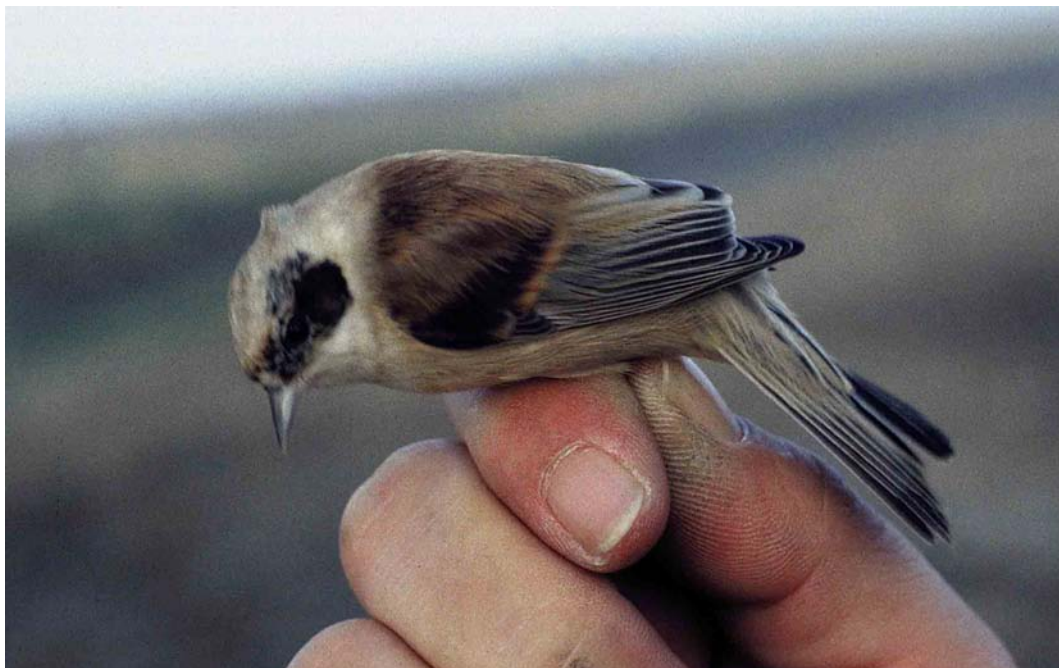
33 Buidelmees / Eurasian Penduline Tit Remiz pendulinus , eerste-kalenderjaar mannetje / first calendar-year male, Verdronken Land van Saeftinge, Hulst, Zeeland, 24 december 1997 ( Alex Wieland ) 34 Buidelmees / Eurasian Penduline Tit Remiz pendulinus , tweede-kalenderjaar mannetje / second calendar-year male, Verdronken Land van Saeftinge, Hulst, Zeeland, 21 november 1998 ( Alex Wieland ). Zelfde individu als in plaat 33 / same individual as in plate 33