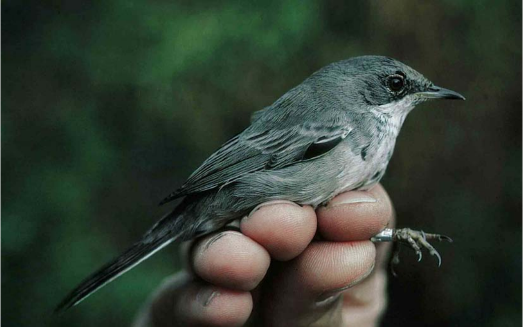
38 Cyprus Warbler / Cyprusgrasmus Sylvia melanothorax , first-winter male, Eilat, Israel, 24 November 1992

proach either. The underparts of female Italian regularly show the diffuse dark streaks and dots typical of female Spanish. The upperparts can resemble those of Spanish but are often rather similar to those of House, being rather rufous-toned with warm buff 'tramlines', and thus differ in this respect from the mystery bird.