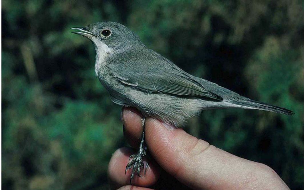
39 Sardinian Warbler / Kleine Zwartkop Sylvia melanocephala , first-winter female, Eilat, Israel, 10 November 1992