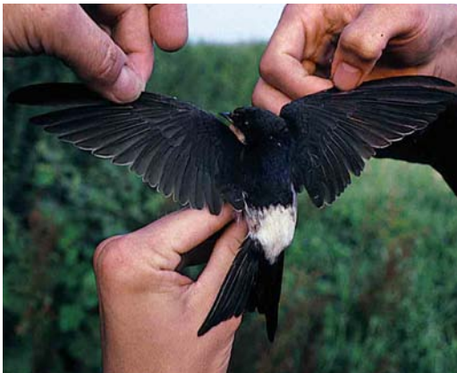
28-29 Hybrid Barn Swallow x House Martin / Boerenzwaluw x Huiszwaluw Hirundo rustica x Delichon urbica , Elburg, Gelderland, 28 July 1995

Whether hybrids of Barn Swallow x House Martin are fertile and able of producing offspring