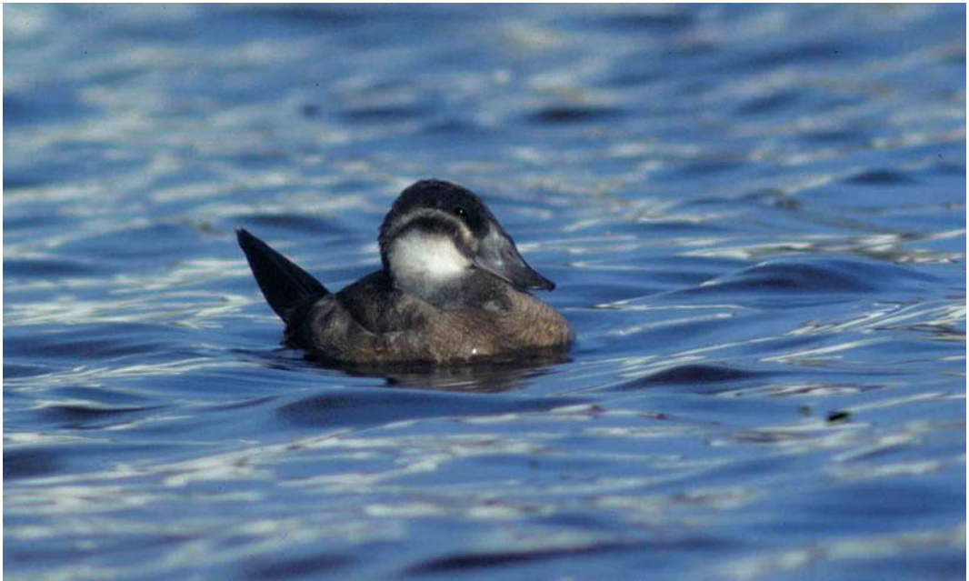
24 Witkopeend / White-headed Duck Oxyura leucocephala , eerste-winter, Kleine Nieuwe Diep, Amsterdam, Noord-Holland, 21 januari 1998

De vogel schuwde ruw water niet, maar bevond zich ook geregeld meer in de luwte waar hij meestal lag te slapen. Anderen zagen de vogel vaak langere tijd achtereen duikend voedselzoeken. GvD zag op 21 januari dat hij belangstellend op een Meerkoet Fulica atra afzwom die zojuist een grote zoetwatermossel opgedoken had.