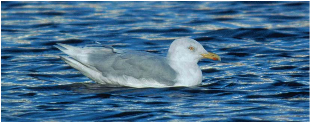
51 Pontische Meeuw / Pontic Gull Larus cachinnans cachinnans , Scheveningen, Zuid-Holland, 6 januari 1999 (Arnoud B van den Berg) 52 Kleine Burgemeester / Iceland Gull Larus glaucooides , eerste-winter, Scheveningen, Den Haag, Zuid-Holland, 30 januari 1999 (Jan van Holten) 53 Grote Burgemeester / Glaucous Gull Larus hyperboreus , Den Helder, Noord-Holland, 29 januari 1999 (Harm Niessen)

veningen lijkt als een nachtkaaers uit te gaan. Ondanks stemmen die het tegendeel beweren lijkt het er steeds meer op dat deze vogel onvoldoende kwalificaties heeft om als eerste voor Nederland gearhiveerd te worden. Pontische Meeuwen L. cachinnans cachinnans en Geelpootmeeuwen L. michahellis bleven gemeld worden van steeds meer plekken in ons land. Pontische Meeuw blijkt de overhand te hebben en met name