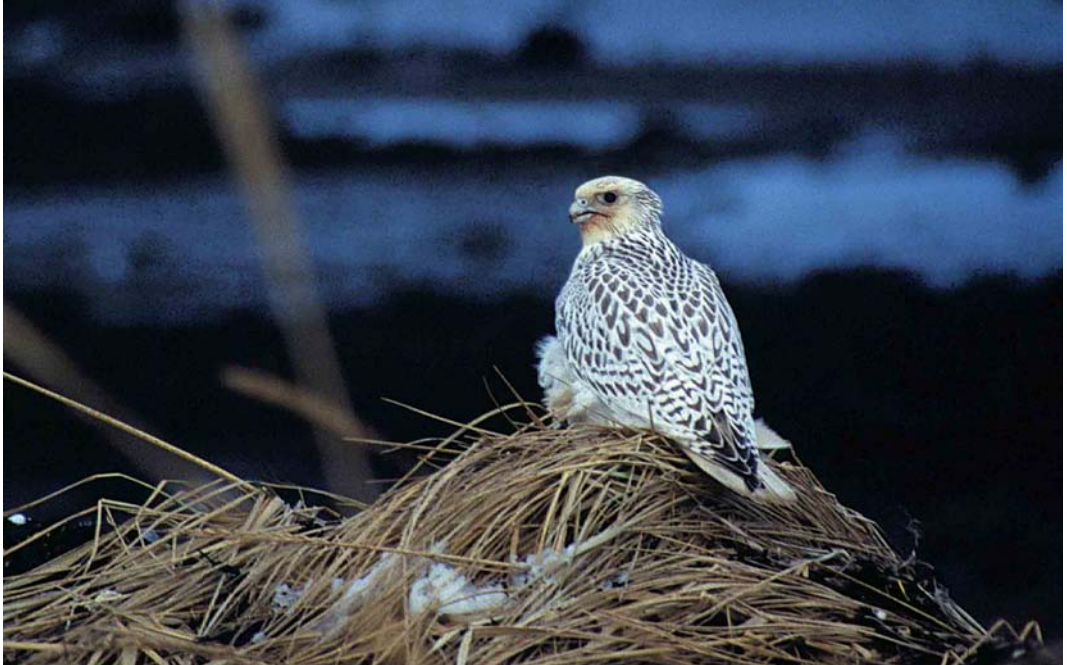
41 Gyr Falcon / Giervalk Falco rusticolus , Njarðvíkurfitjar, Iceland, 15 December 1998 (Yann Kolbeinsson)

Halland, Sweden. In Bulgaria, 230 Dalmatian Pelicans Pelecanus crispus and more than 1300 Pygmy Cormorants Microcarbo pygmeus were counted on 5 January. On 23-24 January, the first Pygmy Cormorant for the Netherlands stayed along Hollandse IJssel at Mastwijk, Montfoort, Utrecht. In Britain, a female Magnificent Frigatebird Fregata magnificens was found exhausted on 22 December 1998 in a field at Scarletts Point, Isle of Man, and was taken into care (where it was still alive in February).