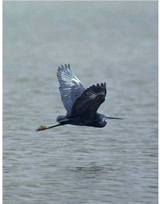
10-12 Western Reef Egret or dark-morph Little Egret / Westelijke Rifeiger of donkere vorm Kleine Zilverreiger Egretta gularis gularis or E garzetta , Merzouga, Tafilalt, Morocco, 22 April 1997 (Arnaud B van den Berg) 13 Western Reef Egret or dark-morph Little Egret / Westelijke Rifeiger of donkere vorm Kleine Zilverreiger Egretta gularis gularis or E garzetta and Little Egret / Kleine Zilverreiger, Merzouga, Tafilalt, Morocco, 22 April 1997 (Arnaud B van den Berg)