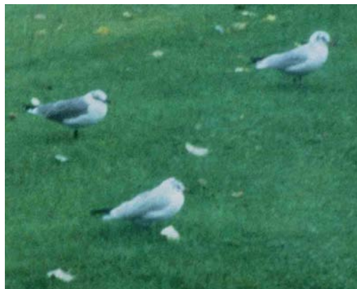
20-21 Lachmeeuw / Laughing Gull Larus atricilla , adult, Harderwijk, Gelderland, 25 september 1993

Enkele weken later kreeg WvH de dia's terug en stuurde de beste (de meeste waren door het sombere weer lang belicht en daardoor zeer onscherp) als 'raadselmeeuw' naar Marc Plomp met een begeleidende brief waarin aanvullende kenmerken vermeld werden. Met het oog op een