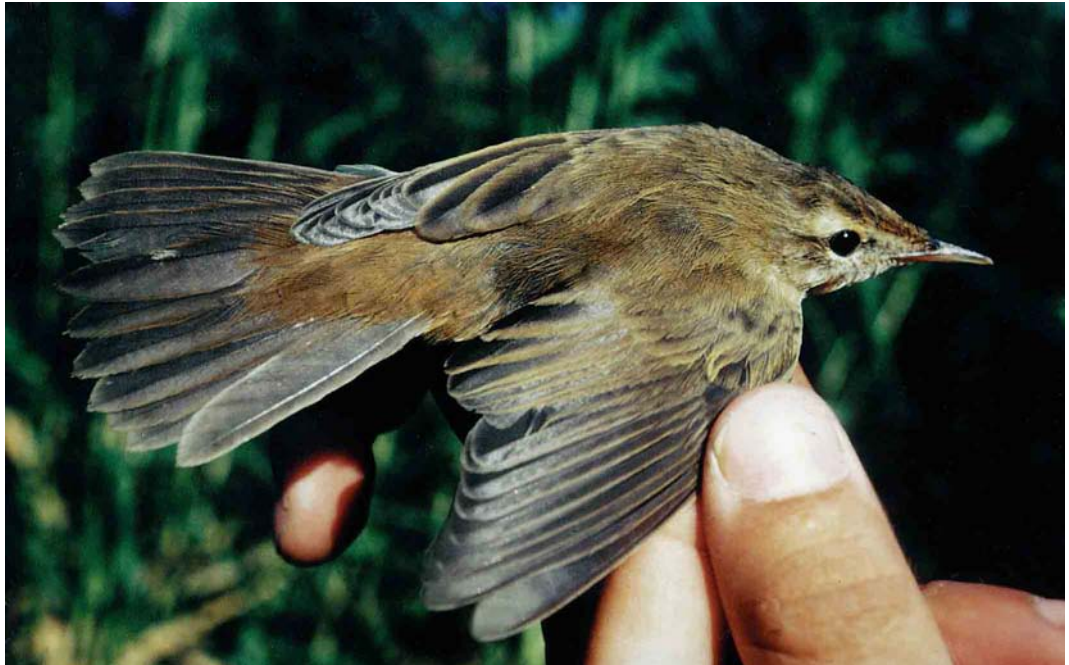
32 Waarschijnlijke hybride Rietzanger x Kleine Karekiet / probable hybrid Sedge Warbler x European Reed Warbler Acrocephalus schoenobaenus x scirpaceus , Laajalahti, Finland, 10 augustus 1980

Gelet op de tongvlekken en de vrij gave handen armpennen betrof het een eerstejaars vogel (cf Svensson 1992). De herkomst is uiteraard onbekend, maar verondersteld wordt, gezien de vroege vangdatum en de terugvangst een week later, dat het een plaatselijke vogel betrof. Dit lijkt op zich opmerkelijk, omdat de twee soorten