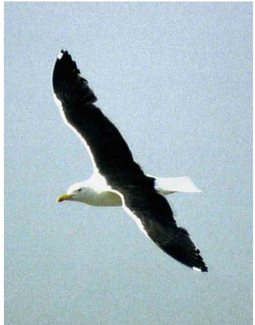
23 Baltische Mantelmeeuw / Baltic Gull Larus fuscus , adult, Schiermonnikoog, Friesland, 19 oktober 1992

Hierdoor wordt de keuze beperkt tot Baltische Mantelmeeuw en Kleine Mantelmeeuw (waarvan de noordelijke vogels zeer donkere bovendelen kunnen laten zien). Het onderscheid tussen deze taxa wordt op veel plaatsen in de literatuur behandeld. De nadruk ligt hierin op biometrische verschillen en de kleur van de bovendelen. Het uiterlijk van de vogel van Schiermonnikoog past beter op Baltische Mantelmeeuw dan op een donkere Kleine Mantelmeeuw. De bijna zwarte kleur van vleugel en bovendelen klopt goed voor Baltische Mantelmeeuw die in vergelijking met Kleine Mantelmeeuw een (nog) donkerdere bovenzijde laat zien (zonder het bij Kleine Mantelmeeuw vaak voorkomende blauwgrijze was). Ook de aanwezigheid van een enkele 'mirror' in p10 en het ontbreken van een duidelijk contrast in de vleugelpunt past beter op Baltische Mantelmeeuw maar sluit Kleine Mantelmeeuw niet uit. Het ontbreken van witte toppen aan de buitenste handpennen past goed op Baltische Mantelmeeuw; Kleine Mantelmeeuw heeft doorgaans zelfs in gesleten kleed duidelijke witte handpentoppen (Jonsson 1998). Andere kenmerken, zoals de bij Baltische Mantelmeeuw rondere kop, kortere snavel, kortere poten en langere, smallere vleugels (en daardoor in zit langere handpenprojectie; cf Cramp &