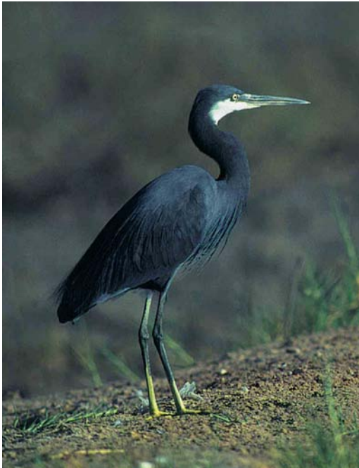
14 Western Reef Egret / Westelijke Rifeiger Egretta gularis gularis , Gambia, December 1996. Note largely pale tibia 15 Western Reef Egret / Westelijke Rifeiger Egretta gularis gularis , La Capellière, Camargue, Bouches-du-Rhône, France, 27 August 1990

The white forehead and partly white crown and the large white area on the outerwing are rare in dark-morph Western Reef Egret. Yves Kayser (in litt) pointed out that he has seen Western Reef in Mauritania with similar head pattern but not with quite as much white in the wing.