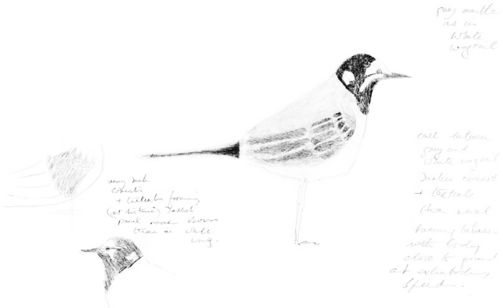
FIGURE 1 Moroccan Wagtail / Marokkaanse Kwikstaart Motacilla subpersonata , adult male, Mina de São Domingos, Mértola, Alentejo, Portugal, 13 July 1995 (C C Moore)

ed on 14 July and supplementary notes were taken. The extraordinary speed of the bird on the ground prevented photography but extensive notes were taken and a field sketch (figure 1) was made on 13 July while watching the bird; the notes are summarized here.