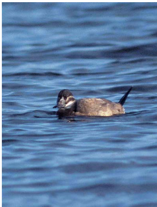
25-26 Witkopeend / White-headed Duck Oxyura leucocephala , eerste-winter, Kleine Nieuwe Diep, Amsterdam, Noord-Holland, 21 januari 1998

Het is opmerkelijk dat de waarneming werd gedaan op het Kleine Nieuwe Diep, een plaats waar, of vlak waarbij, al vaker Witkopeenden zijn gezien, namelijk in februari-maart 1956, in januari-maart 1965 en op 24 februari 1985 (cf Vlek 1995, van den Berg & Bosman 1999).