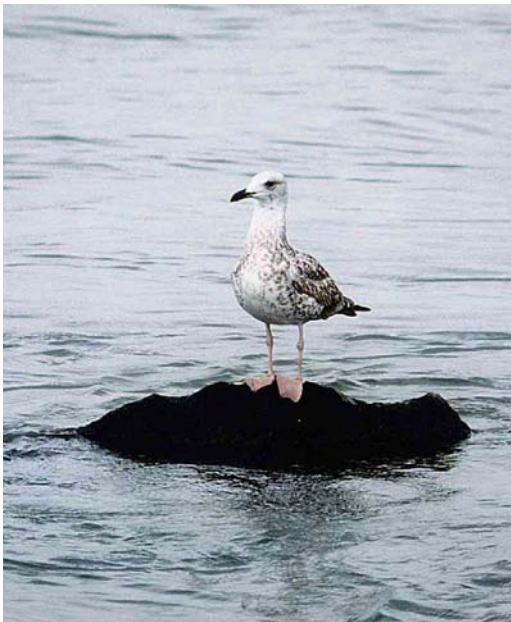
35-36 Presumed Yellow-legged Gull / vermoedelijke Geelpootmeeuw Larus michahellis , Nieuwe Waterweg, Rozenburg, Zuid-Holland, Netherlands, 1 September 1997

The lesser and median coverts look a little messy with apparently some broader pale indentations. This is typical of michahellis , cachinnans more commonly showing a simple pattern of