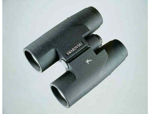
Swarovski SLC 7x42 B binoculars

Entries for the first round have to arrive by 25 April 1999 . From those entrants having identified both mystery birds correctly, three persons will be drawn who will receive a copy of The raptors