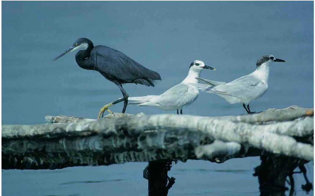
16 Western Reef Egret / Westelijke Rifeiger Egretta gularis gularis and Sandwich Terns / Grote Sterns Sterna sandvicensis , Ile de Pontalée, Senegal, 12 January 1997. Note bill colour with brownish tip

1984). In that context, it is noteworthy that some authors not only consider Western Reef and Indian Reef specifically distinct, but also split Indian Egret in two species ('Red Sea Reef Egret E schistacea ' and 'Indian Reef Egret E asha ', the latter occurring from Persian Gulf to Sri Lanka) (eg, Walters 1997). All Western Reef were recorded in the southern half of France. Breeding may have occurred for the first time in 1958, possibly paired with Little Egret, and again several times possibly in mixed pairs in 1990-96 (Dubois & Yésou 1995, Ornithos 4: 143, 1997). Further south, the species has been recorded quite often in Italy where 20 out of 30 dark egrets in 1960-91 could be identified as one of the two reef egret taxa (Grussu 1993). There are several records for Spain, where the first was recorded with certainty in June 1970 (Hiraldo Cano 1971) and where, at l'Albufera de Valencia, one produced young since 1988 while being paired with Little (Díes & Díes 1997). If the Merzouga bird were accepted as Western Reef, it would be the 19th record for Morocco, the 12th of a dark-morph (Jacques Franchimont in litt). Moreover, there might be no other record at such a large distance from sea. The species' vagrancy poten-