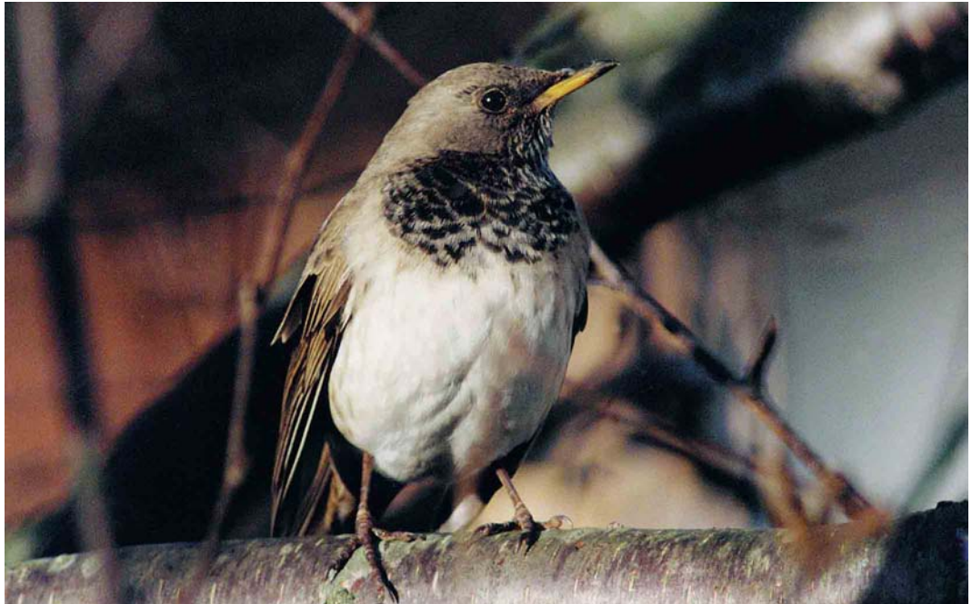
47 Black-throated Thrush / Zwartkeellijster Turdus ruficollis atrogularis , Woodlands Park, Maidenhead, Berkshire, England, January 1999