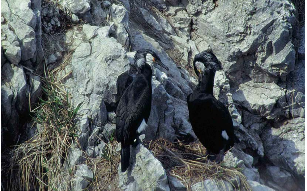
4 Temminck's Cormorants / Japanese Aalscholvers Phalacrocorax capillatus , adults, summer plumage, Honshu, Japan, June 1998 (Mike Danzenbaker). These birds showing broad yellow facial skin behind eye, all-black bill, extensive pale cheek-patch and greenish sheen on wing-coverts 5 Temminck's Cormorants / Japanese Aalscholvers Phalacrocorax capillatus , adults, starting moult from summer to winter plumage, Honshu, Japan, June 1998 (Mike Danzenbaker). Note extension of white feathering along base of bill