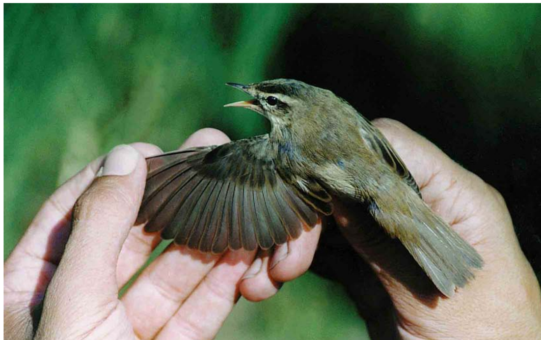
30 Hybride Rietzanger x Kleine Karekiet / hybrid Sedge Warbler x European Reed Warbler Acrocephalus schoenobaenus x scirpaceus , Makkum, Friesland, 9 augustus 1997 (Frank Majoor) 31 Hybride Rietzanger x Kleine Karekiet / hybrid Sedge Warbler x European Reed Warbler Acrocephalus schoenobaenus x scirpaceus (rechts) en Rietzanger / Sedge Warbler (links), Makkum, Friesland, 9 augustus 1997 (Frank Majoor)