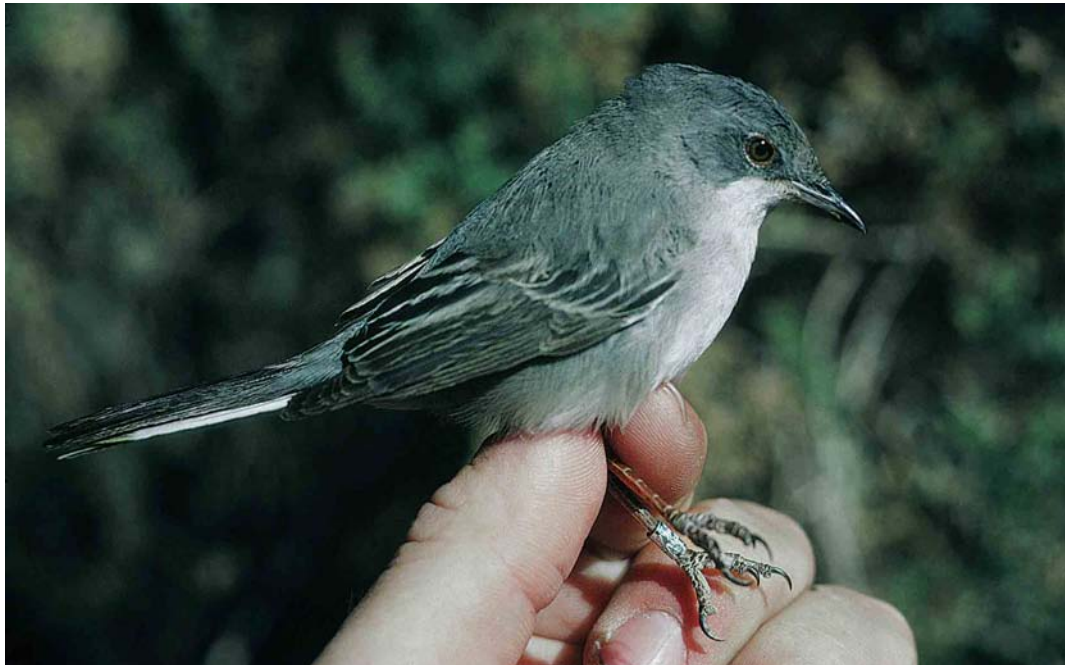
40 Rüppell's Warbler / Rüppells Grasmus Sylvia rueppelli , female, Eilat, Israel, 9 April 1993