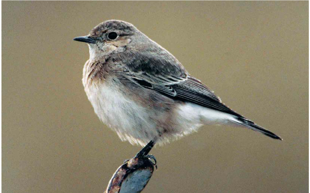
46 Pied Wheatear / Bonte Tapuit Oenanthe pleschanka , Tynemouth, Tyneside, England, December 1998