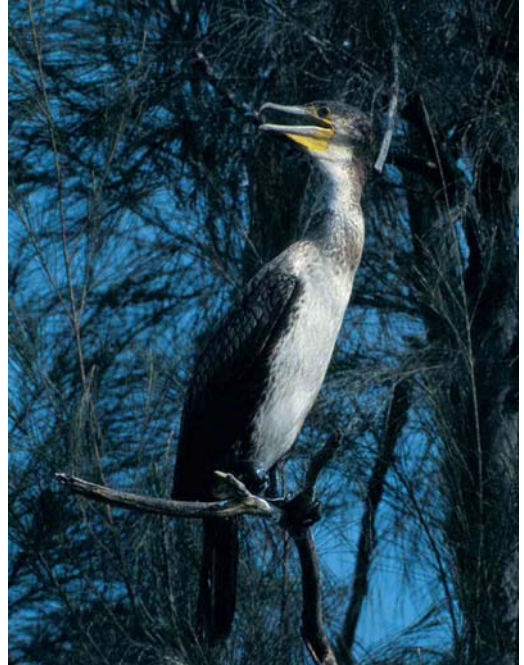
6 Great Cormorant / Aalscholver Phalacrocorax carbo of subspecies hanedae , adult, summer plumage, Honshu, Japan, February 1997. This bird showing bronze tones on wing-coverts characteristic of Great Cormorant. In addition, white filoplumes covering whole crown and almost reaching bottom edge of cheek-patch. Note yellow facial skin not extending up behind eye or tapering to sharp point at gape and pale base to lower 7 Great Cormorant / Aalscholver Phalacrocorax carbo of subspecies sinensis , immature, Hong Kong, China, October 1996. Immature sinensis showing much more extensive white on underparts than P c hanedae , matching that of immature Temminck's Cormorant P capillatus . Note yellow orbital ring of this bird. Great Cormorant commonly showing this but never matching broad extension of yellow skin up behind eye shown by Temminck's Cormorant

showing fewer and shorter filoplumes. Some individuals have already lost the white thigh-patch by this date too and may even begin to show the paler throat and breast-mottling characteristic of winter plumage. In breeding plumage, Temminck's Cormorants have a general resemblance to Great Cormorants, showing an all-black body and wings with a conspicuous white thigh-patch and pale cheeks. The cheek-patch is probably even more mottled in breeding plumage. Especially early in the breeding season, they also have conspicuous white filoplumes on the sides of the head and upper neck. Both species show considerable variation in the extent and thickness of the white filoplumes although Temminck's may have a greater tendency to show very thick filoplumes, enhancing its big-headed appearance. In addition, in Temminck's, there is typically a broad black divide between the pale cheek-patch and the start of the filo-