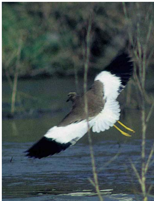
17 Witstaartkievit / White-tailed Lapwing Vanellus leucurus , Assendelft, Noord-Holland, 23 februari 1998 (René Pop) 18 Witstaartkievit / White-tailed Lapwing Vanellus leucurus , Assendelft, Noord-Holland, 23 februari 1998 (Arnoud B van den Berg) 19 Witstaartkievit / White-tailed Lapwing Vanellus leucurus , Assendelft, Noord-Holland, 23 februari 1998 (René Pop)