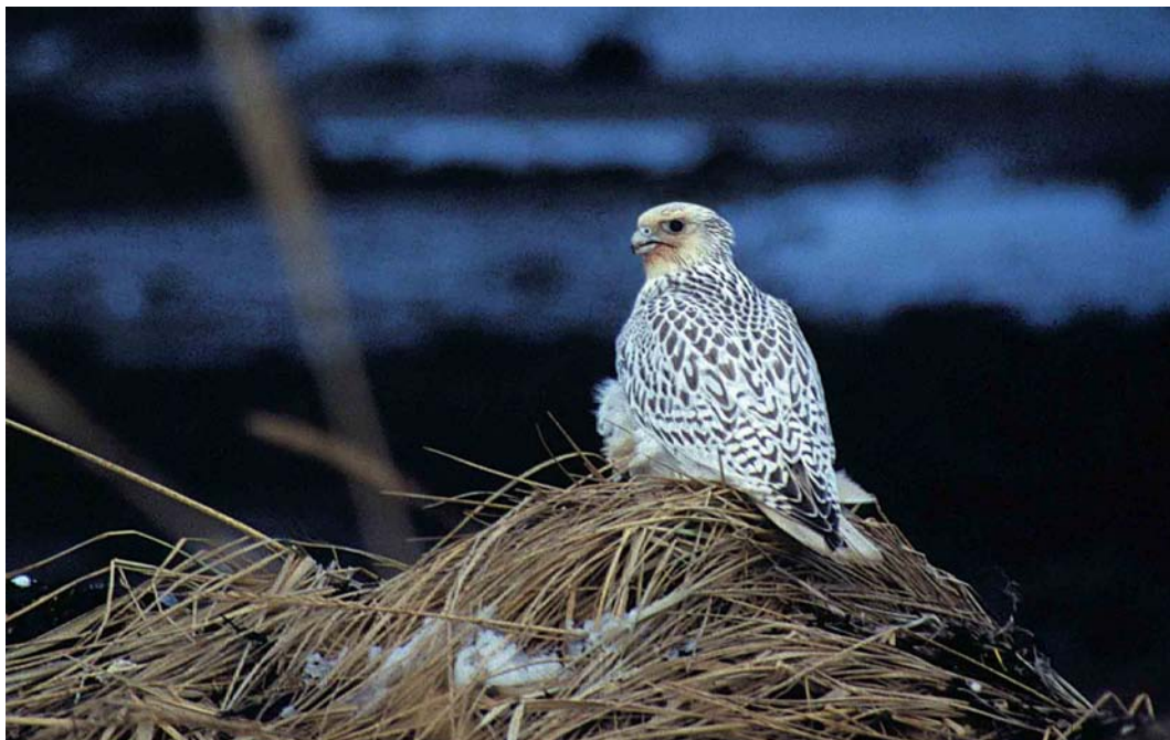
41 Gyr Falcon / Giervalk Falco rusticolus , Njarðvíkurfitjar, Iceland, 15 December 1998 (Yann Kolbeinsson)

Halland, Sweden. In Bulgaria, 230 Dalmatian Pelicans Pelecanus crispus and more than 1300 Pygmy Cormorants Microcarbo pygmeus were counted on 5 January. On 23-24 January, the first Pygmy Cormorant for the Netherlands stayed along Hollandse IJssel at Mastwijk, Montfoort, Utrecht. In Britain, a female Magnificent Frigatebird Fregata magnificens was found exhausted on 22 December 1998 in a field at Scarletts Point, Isle of Man, and was taken into care (where it was still alive in February).