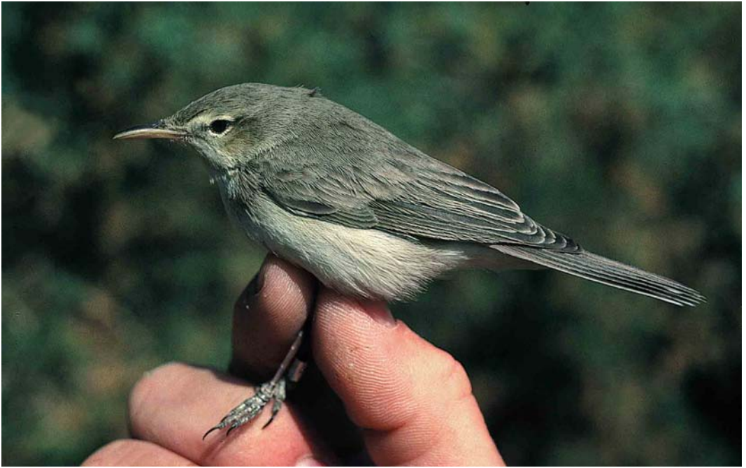
174 Eastern Olivaceous Warbler / Oostelijke Vale Spotvogel Acrocephalus pallidus elaeicus , Eilat, Israel, 11 March 1993