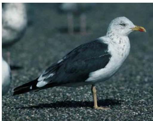
151 Lesser Black-backed Gull / Kleine Mantelmeeuw Larus graellsii , second-summer, Maasvlakte, Zuid-Holland, Netherlands, 18 May 1990 ( Arie de Knijff ). Note brownish wing-coverts and tertials contrasting with largely blue-grey mantle and scapulars 152 Lesser Black-backed Gull / Kleine Mantelmeeuw Larus graellsii , probably second-summer, Maasvlakte, Zuid-Holland, Netherlands, June 1993 ( Peter de Knijff ) 153 Lesser Black-backed Gull / Kleine Mantelmeeuw Larus graellsii , third-winter, Essaouira, Morocco, 2 March 1999 ( Theo Bakker/Cursorius ). Profile of head and bill rather atypical 154 Lesser Black-backed Gull / Kleine Mantelmeeuw Larus graellsii , probably third-winter, IJmuiden, Noord-Holland, Netherlands, 30 January 1994 ( Arie de Knijff ) 155 Lesser Black-backed Gull / Kleine Mantelmeeuw Larus graellsii , third-winter, Essaouira, Morocco, 2 March 1999 ( Theo Bakker/Cursorius ) 156 Lesser Black-backed Gull / Kleine Mantelmeeuw Larus graellsii , adult, Brouwersdam, Zuid-Holland, Netherlands, 27 September 1992 ( Arie de Knijff ). Note stage of moult typical for graellsii ; inner primaries to p6 fresh, outer primaries old, absent or re-growing