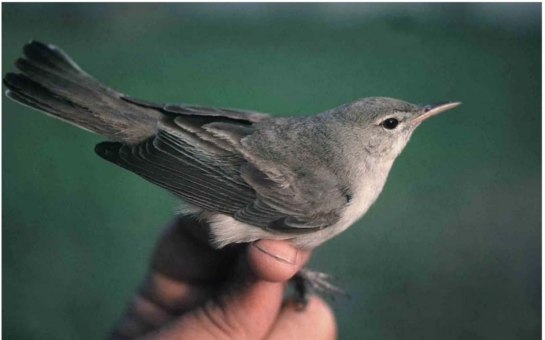
173 Upcher's Warbler / Grote Vale Spotvogel Hippolais languida , Jubail, Gulf, Saudi Arabia, 30 April 1991