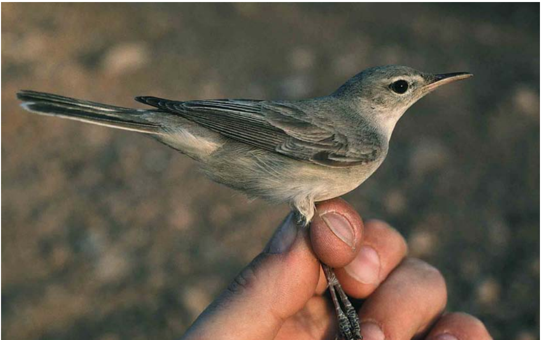
175 Upcher's Warbler / Grote Vale Spotvogel Hippolais languida , Birecik, Turkey, 25 May 1994