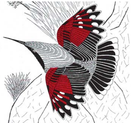
FIGURE 1 Wallcreeper / Rotskruiper Tichodroma muraria during 'investigative flight' (Miroslav Saniga) FIGURE 2 Wallcreeper / Rotskruiper Tichodroma muraria during characteristic downward 'gliding flight' (Miroslav Saniga) FIGURE 3 Wallcreeper / Rotskruiper Tichodroma muraria during attack by aerial predator. Bird makes erratic flight with abrupt turns (side-slipping) (Miroslav Saniga) FIGURE 4 Wallcreeper / Rotskruiper Tichodroma muraria during traverse climbing with characteristic wing- and tail-flicking (Miroslav Saniga) FIGURE 5 Wallcreeper / Rotskruiper Tichodroma muraria during vertical hopping (Miroslav Saniga) FIGURE 6 Wallcreeper / Rotskruiper Tichodroma muraria . While climbing, expressing excitement or alertness by extent and angle of wing-flicking (Miroslav Saniga)