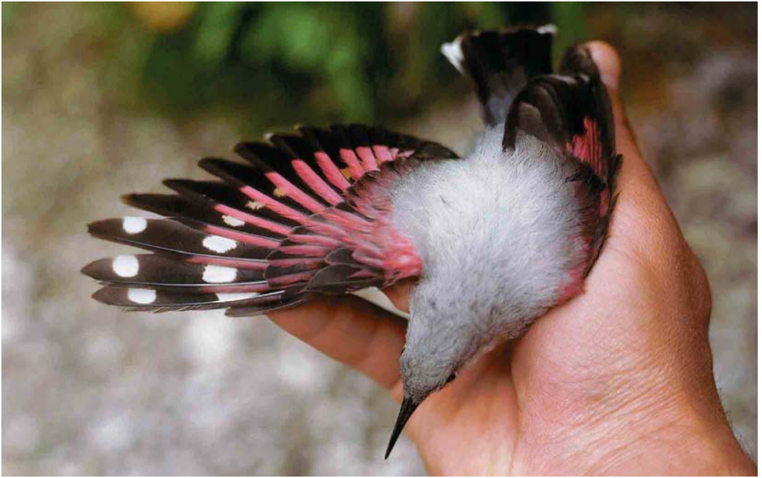
167 Wallcreeper / Rotskruiper Tichodroma muraria , female, Malá Fatra mountains, Slovakia, 2 July 1991 (Miroslav Saniga)

with spread wings and is blown upwards, almost without moving the wings. It especially shows its extraordinary agility and manoeuvrability when attacked by aerial predators like Eurasian Sparrowhawk Accipiter nisus , Common Kestrel Falco tinnunculus , Eurasian Hobby F subbuteo or Peregrine Falcon F peregrinus . It flutters about wildly in all directions close to the rock face, thus evading attack (figure 3). The species also shows extraordinary manoeuvrability in aerial tussles of rivals or when male and female flutter about each other when they happen to meet in the vicinity of the nest.