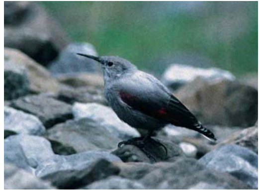
169 Wallcreeper / Rotskruiper Tichodroma muraria , Cirque de Gavarnie, Hautes-Pyrénées, France, 7 September 1995 (Arnoud B van den Berg)

inconspicuous bird, merging perfectly with the blue-grey background, into a very conspicuous bird. Wing-flicking is a slow movement performed constantly, not only when climbing but also when feeding or resting briefly. Juveniles do this as soon as they have fledged.