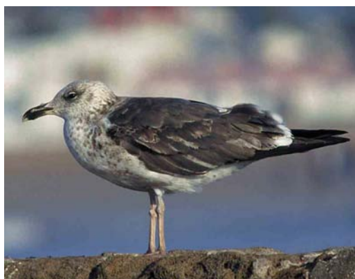
139 Yellow-legged Gull / Geelpootmeeuw Larus michahellis , juvenile moulting to first-winter, Scheveningen, Zuid-Holland, Netherlands, 21 November 1998. Combination of heavy body and rather large bill, pale head and belly, paler inner primaries and already heavily worn plumage distinguishes this bird from fuscus and graellsii 140 Lesser Black-backed Gull / Kleine Mantelmeeuw Larus graellsii , first-summer moulting to second-winter, Scheveningen, Zuid-Holland, Netherlands, 19 August 1997 141 Lesser Black-backed Gull / Kleine Mantelmeeuw Larus graellsii , first-summer moulting to second-winter, Brouwersdam, Zuid-Holland, Netherlands, 1 November 1992 142 Lesser Black-backed Gull / Kleine Mantelmeeuw Larus graellsii , second-winter, Essaouira, Morocco, 2 March 1999

ing the autumn migration. This explains why third-calendar-year and older graellsii do not show any sign of moult in February-May but, instead, some individuals show abraded primaries in spring. Most second-calendar-year graellsii do not moult primaries before May but the same also applies for some fuscus of similar age.