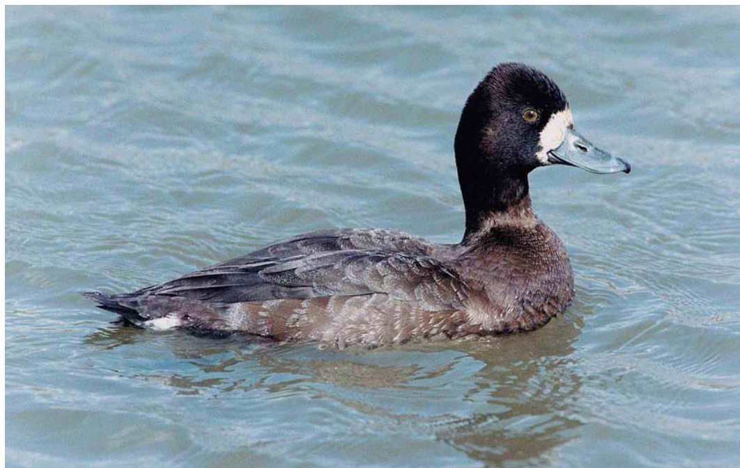
176 Lesser Scaup / Kleine Topper Aythya affinis , Cleethorpes, Lincolnshire, England, April 1999 (Iain H Leach)

and at least four in Belgium (where also four pulli were ringed at Brecht, Antwerpen). The second singing in Britain this century was at Grove Ferry, Kent, from 6 June onwards. The first sound-recorded in Portugal was at Lagoa dos Patos, Ferreira do Alentejo, on 5 June. At the Kizilirmak delta, confirmation of the presence (and breeding) of Grey-headed Swamp-hen Porphyrio poliocephalus on the Turkish Black Sea coast was provided by the observation of an adult with two fledged young on 27 June. The second American Coot Fulica americana for Britain was photographed at South Walney, Cumbria, on 17 April.