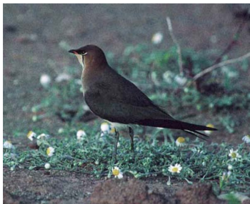
183 Black-winged Pratincole / Steppenvorkstaartplevier Glaucopis tricolor , Mandria, Paphos, Cyprus, 15 April 1999 (Adrian Jordi)

Øystre, Finnmark, Norway, a second-year Ivory Gull Pagophila eburnea was found among Black-legged Kittiwakes Rissa tridactyla on 6 June. On Sylt, Schleswig-Holstein, Germany, three Lesser Crested Terns Sterna bengalensis were seen flying past on 19 May. Three adult Roseate Terns S. dougallii were seen at Oued Souss, Agadir, Morocco, on 27 April. In England, a first-summer Forster's Tern S. forsteri remained from 29 May to at least early July at Tollesbury Fleet, Kent. The first Bridled Tern S. anaethetus for Germany flew about along the southern bank of the Elbe, between Hamburg and Niedersachsen, on 1-2 June and perhaps the same was on Helgoland, Schleswig-Holstein, on 3-4 June. On 30 June, the first for Sweden was discovered at Sörskär, Bohuslän. In the Netherlands, a flock of 14 Whiskered Terns Chlidonias hybridus turned up south of Maastricht, Limburg, on 1 May. The species' continued presence during May-June in other parts resulted in the country's 42nd breeding record, at Soerendonks Goor, Noord-Brabant, where at least one young fledged in the third week of June; previous breeding records were in 1938 (nine), 1945 (nine), 1958 (15), 1965 (seven) and 1997 (one).