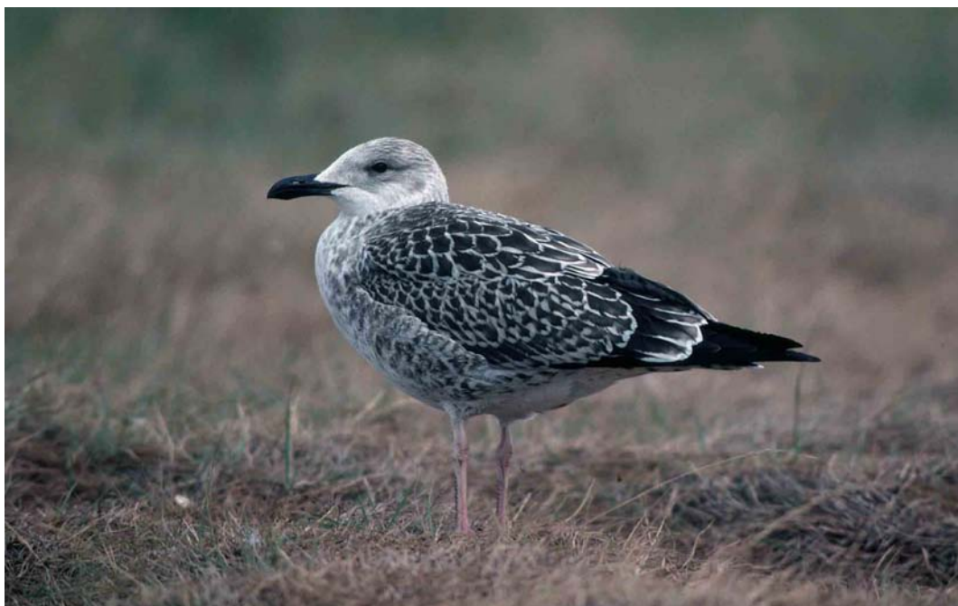
116 Lesser Black-backed Gull / Kleine Mantelmeeuw Larus graellsii , juvenile, Maasvlakte, Zuid-Holland, Netherlands, August 1990 ( Arie de Knijff ). Rather pale-headed individual 117 Baltic Gull / Baltische Mantelmeeuw Larus fuscus , juvenile, Turku, Finland, 3 September 1997 ( Harry J Lehto ). Note pattern of fresh first-winter scapulars, whitish fringes of wing-coverts and tertials, and pale ground colour of head and underparts