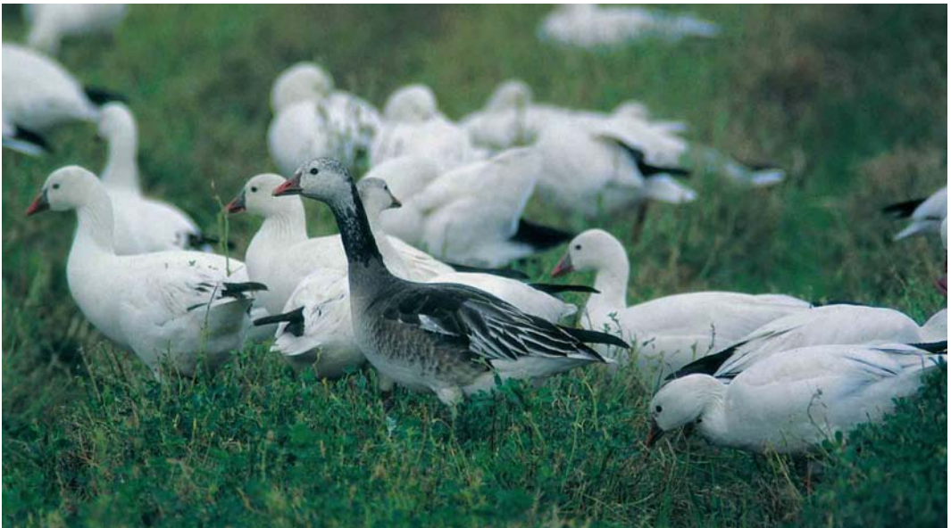
171 Ross's Geese / Ross' Ganzen Anser rossii , immature blue morph with adults white morph, Salton Sea, California, USA, January 1998

The blue morph of Ross's Goose is extremely rare and much more enigmatic than blue Snow Goose. The existence of this morph was confirmed as recently as 1971 (Cook & Ryder 1971). A few years later, Todd (1979) stated: 'Recent docu-