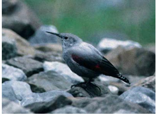
169 Wallcreeper / Rotskruiper Tichodroma muraria , Cirque de Gavarnie, Hautes-Pyrénées, France, 7 September 1995

inconspicuous bird, merging perfectly with the blue-grey background, into a very conspicuous bird. Wing-flicking is a slow movement performed constantly, not only when climbing but also when feeding or resting briefly. Juveniles do this as soon as they have fledged.