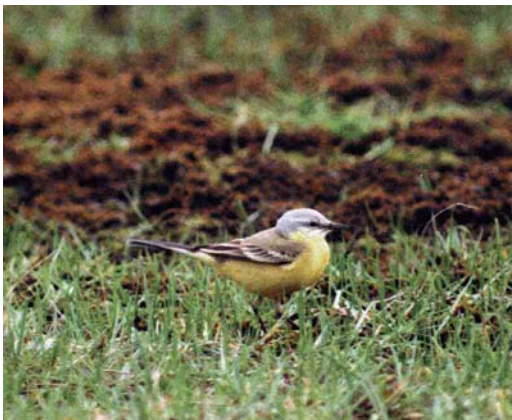
182 Possible Sykes's Blue-headed Wagtail / mogelijke Russische Gele Kwikstaart Motacilla flava beema , Maasvlakte, Zuid-Holland, Netherlands, 24 April 1999 (Bas van den Boogaard)