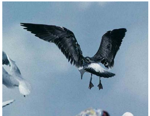
133 Baltic Gull / Baltische Mantelmeeuw Larus fuscus , juvenile, Lahti, Finland, 27 August 1997 ( Visa Rauste ). Note greater wing-coverts with dark base and large pale tip 134 Baltic Gull / Baltische Mantelmeeuw Larus fuscus , juvenile, Lahti, Finland, 24 September 1997 ( Visa Rauste ). Fairly pale individual 135 Baltic Gull / Baltische Mantelmeeuw Larus fuscus , first-summer, Turku, Finland, 10 August 1993 ( Henry Lehto ). Fresh primaries, plain blackish-brown mantle feathers and scapulars in combination with pale dark-speckled underparts characteristic for this plumage; bicoloured bill also typical (normally, uniformly dark in grællsiö ) 136 Baltic Gull / Baltische Mantelmeeuw Larus fuscus , first-summer, Topinoja, Finland, 17 July 1998 ( Harry J Lehto ). Inner primaries to p7 fresh, in contrast with older and browner p10 (p8-9 missing or not visible) 137 Baltic Gull / Baltische Mantelmeeuw Larus fuscus , first-summer, Topinoja, Finland, 19 May 1998 ( Harry J Lehto ) 138 Baltic Gull / Baltische Mantelmeeuw Larus fuscus , first-summer, Kuopio, Finland, 9 July 1998 ( Harry J Lehto ). Note variability in tail pattern compared with bird in plate 137