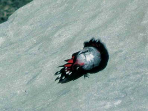
168 Wallcreeper / Rotskruiper Tichodroma muraria , Cirque de Gavarnie, Hautes-Pyrénées, France, 4 September 1995