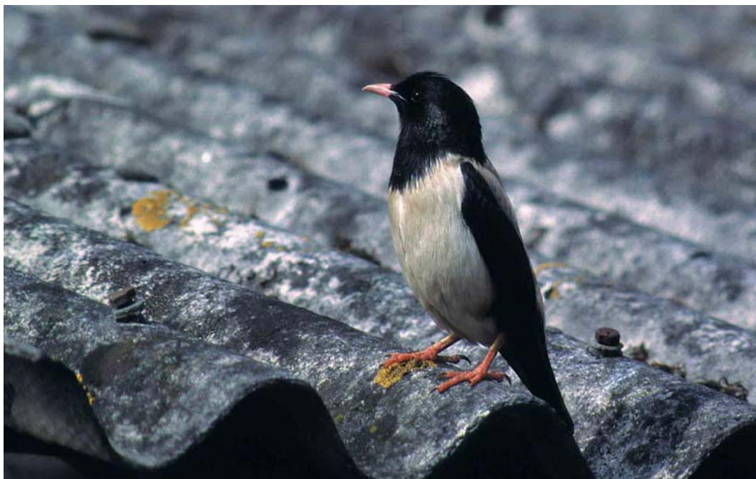
191 Roze Spreeuw / Rose-coloured Starling Sturnus roseus , mannetje, Weesp, Noord-Holland, 1 mei 1999