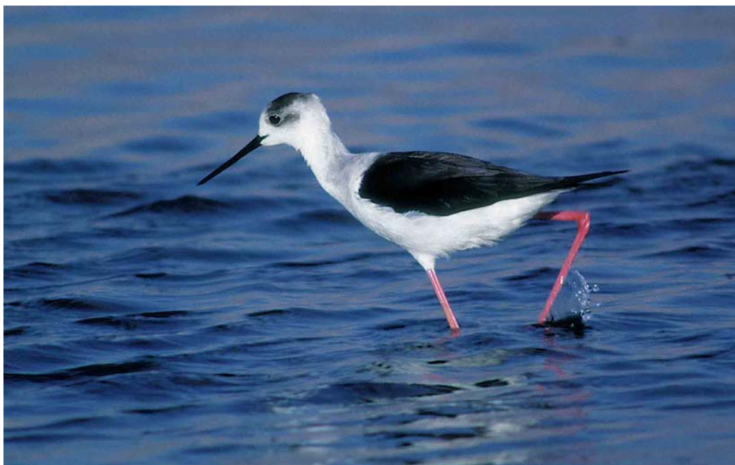
192 Steltkluut / Black-winged Stilt Himantopus himantopus , Noordvaarder, Terschelling, Friesland, 19 mei 1999 (Arie Ouwerkerk)