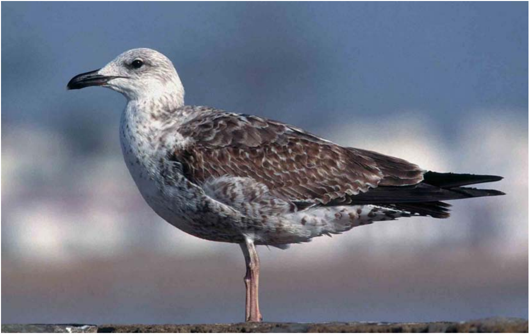
132 Lesser Black-backed Gull / Kleine Mantelmeeuw Larus graellsii , first-winter, Essaouira, Morocco, 2 March 1999

diagnostic, one should always pay attention to a suite of characters. Individual variation makes things even more difficult.