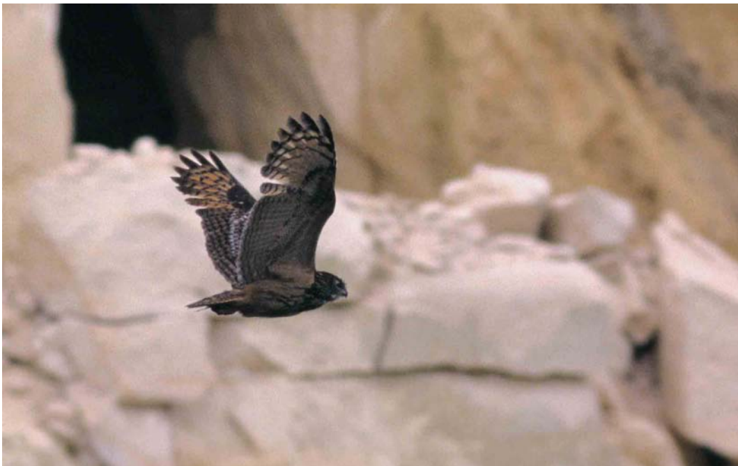
177 Eurasian Eagle Owl / Oehoe Bubo bubo , adult, Maastricht, Limburg, Netherlands, 5 June 1999

legs Tringa flavipes for the Cape Verde Islands was photographed on Boavista on 17 March. An adult summer Spotted Sandpiper Actitis macularia was seen at Loch Spynie, Moray, Scotland, on 25 May. A minor influx of Terek Sandpipers Xenus cinereus in north-western Europe involved, eg, three in April and three in May in Britain, two on 1-2 May in France, two on 12 and 27 May in Belgium, five in May in the Netherlands, three in Denmark from 25 May to 7 June, and three in Norway from 21 May to 9 June. In France, a Wilson's Phalarope Phalaropus tricolor turned up at Brem-sur-Mer, Vendée, on 3 May. The sixth and seventh for Denmark (and the firsts since 1987) were females in Vestjylland at Værnengene, Skjern, on 2-10 May and at Vest Stadil Fjord, Ringkøbing, on 10-11 May. The eighth for Sweden was a male at Hörningsholm, Alnön, Medelpad, on 9 May. In Portugal, an adult summer male was photographed at Pancas, Ribatejo, Tejo estuary, on 26 May. In Germany, one was seen at Katinger Watt, Schleswig-Holstein, on 8 June.