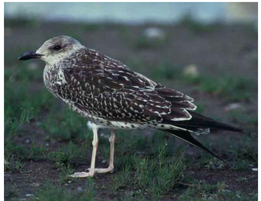
104 Baltic Gull / Baltische Mantelmeeuw Larus fuscus , juvenile, Lahti, Finland, 24 September 1997 ( Henry Lehto ). Note slender and long-winged appearance 105 Baltic Gull / Baltische Mantelmeeuw Larus fuscus , juvenile, Turku, Finland, 7 September 1997 ( Henry Lehto ) 106 Baltic Gull / Baltische Mantelmeeuw Larus fuscus , juvenile, Turku, Finland, 20 August 1997 ( Henry Lehto ) 107 Baltic Gull / Baltische Mantelmeeuw Larus fuscus , juvenile, Lahti, Finland, 27 August 1997 ( Visa Rauste ). Note slender bill, Mew Gull L. canus -like rounded head, long wings, whitish fringes of wing-coverts and tertials, and contrastingly pale underparts 108 Baltic Gull / Baltische Mantelmeeuw Larus fuscus , juvenile, Altwarmbüchener See, Niedersachsen, Germany, October 1997 ( Detlef Gruber ). Dark individual; colour-ringed as pullus (C9C7) at Sahalahti (61:31N, 24:21E), Finland, on 15 July 1997 109 Baltic Gull / Baltische Mantelmeeuw Larus fuscus , juvenile, Lahti, Finland, 22 September 1997 ( Visa Rauste )