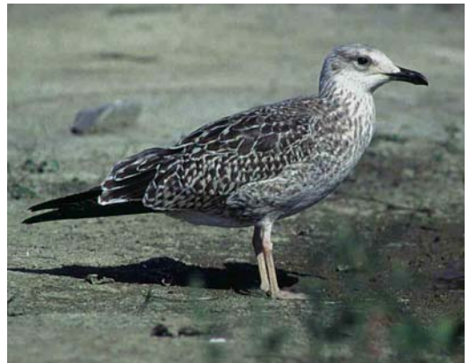
118 Baltic Gull / Baltische Mantelmeeuw Larus fuscus , juvenile, Hanko, Finland, 5 October 1996 (Harry J Lehto). Individual showing dark underwing but note largely unmarked white uppertail-coverts, unlike most graellsii 119 Baltic Gull / Baltische Mantelmeeuw Larus fuscus , juvenile, Turku, Finland, 3 September 1997 (Harry J Lehto) 120 Baltic Gull / Baltische Mantelmeeuw Larus fuscus , juvenile, Turku, Finland, 3 September 1997 (Harry J Lehto). Note extensively pale underparts, axillaries and underwing-coverts 121 Baltic Gull / Baltische Mantelmeeuw Larus fuscus , juvenile, Hanko, Finland, 5 October 1996 (Harry J Lehto). Note contrastingly white belly and long-winged flight silhouette 122 Baltic Gull / Baltische Mantelmeeuw Larus fuscus , juvenile, Turku, Finland, 27 July 1983 (Harry J Lehto) 123 Baltic Gull / Baltische Mantelmeeuw Larus fuscus , juvenile, Lahti, Finland, 3 September 1997 (Visa Rauste)