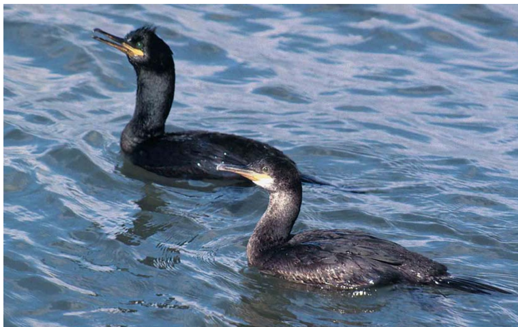
190 Kuifaalscholwers / European Shags Stictocarbo aristotelis , adult en onvolwassen, IJmuiden, Noord-Holland, 15 april 1999