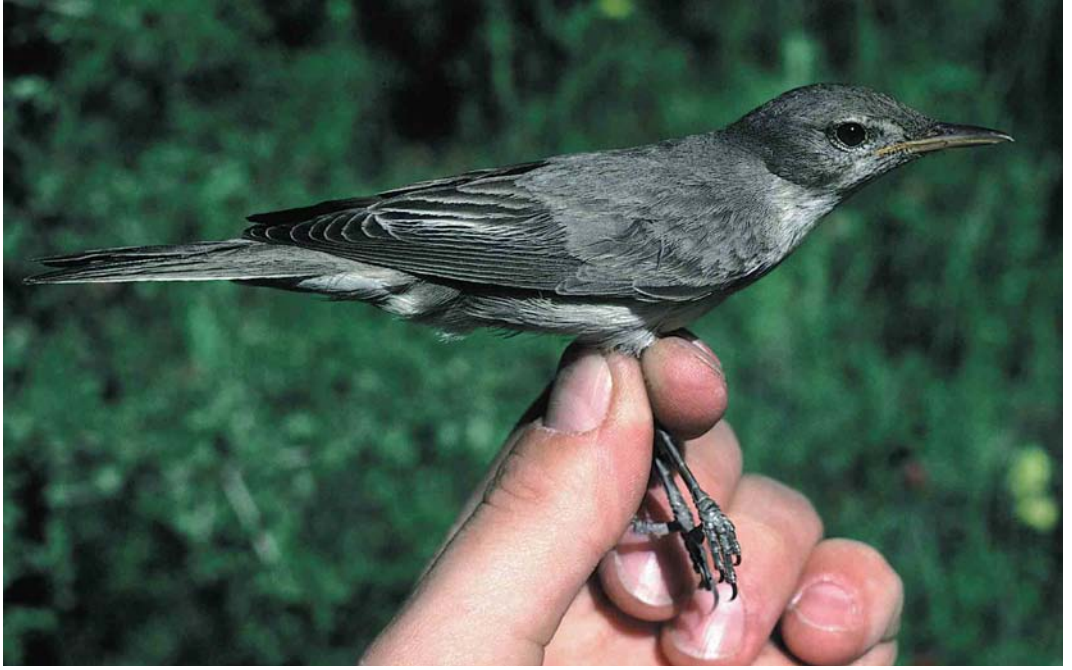
172 Olive-tree Warbler / Griekse Spotvogel Hippolais olivetorum , Birecik, Turkey, 18 May 1994