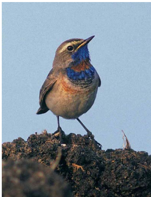
184 Rufous-tailed Rock Thrush / Rode Rotslijster Monticola saxatilis , male, Lauwersmeer, Groningen, Netherlands, 4 May 1999 ( Arie Ouwerkerk ) 185 Red-spotted Bluethroat / Roodsterblauwborst Luscinia svecica svecica , male, Veendam, Groningen, Netherlands, 27 June 1999 ( Arnoud B van den Berg ) 186 White-throated Robin / Perzische Roodborst Irania gutturalis , male, Yotvata, Israel, 19 April 1999 ( Barak Granit ) 187 Thick-billed Lark / Diksnavelleeuwerik Ramphocoris clotbey , southern Negev, Israel, 29 May 1999 ( Barak Granit )