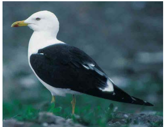
145 Baltic Gull / Baltische Mantelmeeuw Larus fuscus , first-summer, Kuopio, Finland, 9 July 1998 ( Harry J Lehto ) 146 Baltic Gull / Baltische Mantelmeeuw Larus fuscus , second-summer, Kuopio, Finland, 9 July 1998 ( Harry J Lehto ) 147 Baltic Gull / Baltische Mantelmeeuw Larus fuscus , second-summer, Oulu, Finland, 2 June 1998 ( Harry J Lehto ). Few dark tail-markings still visible; combination of adult-looking plumage with dark tail-markings typical for second-summer fuscus 148 Baltic Gull / Baltische Mantelmeeuw Larus fuscus , second-summer, Oulu, Finland, 2 June 1997 ( Henry Lehto ) 149 Baltic Gull / Baltische Mantelmeeuw Larus fuscus , second-summer, Topinoja, Finland, 12 May 1998 ( Henry Lehto ) 150 Baltic Gull / Baltische Mantelmeeuw Larus fuscus , adult, Topinoja, Finland, 6 June 1998 ( Henry Lehto )