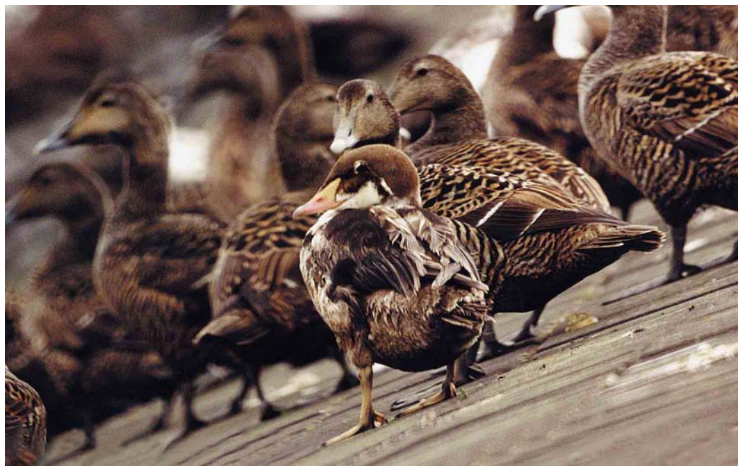
189 Koningseider / King Eider Somateria spectabilis , eerste-zomer mannetje, Vlieland, Friesland, 24 mei 1999 (Jan den Hertog)