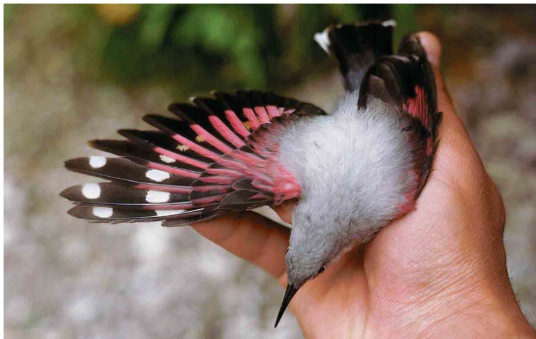
167 Wallcreeper / Rotskruiper Tichodroma muraria , female, Malá Fatra mountains, Slovakia, 2 July 1991

with spread wings and is blown upwards, almost without moving the wings. It especially shows its extraordinary agility and manoeuvrability when attacked by aerial predators like Eurasian Sparrowhawk Accipiter nisus , Common Kestrel Falco tinnunculus , Eurasian Hobby F subbuteo or Peregrine Falcon F peregrinus . It flutters about wildly in all directions close to the rock face, thus evading attack (figure 3). The species also shows extraordinary manoeuvrability in aerial tussles of rivals or when male and female flutter about each other when they happen to meet in the vicinity of the nest.