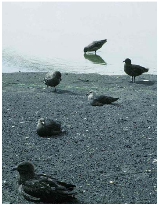
170 Brown Skua Stercorarius arcticus lonnbergi (in front) with South Polar Skuas S maccormicki , Deception Island, December 1995 (Magnus Ullman). Note smaller overall size, smaller head and smaller bill of South Polar Skuas

I have witnessed the same on Petermann Island, further south along the Antarctic Peninsula, where the climate is colder. South Polar Skuas perching on ice and snow did display smaller and more slender bills than the accompanying Brown Skuas.