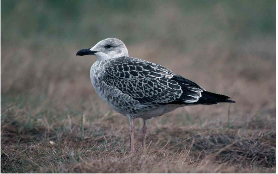
116 Lesser Black-backed Gull / Kleine Mantelmeeuw Larus graellsii , juvenile, Maasvlakte, Zuid-Holland, Netherlands, August 1990. Rather pale-headed individual 117 Baltic Gull / Baltische Mantelmeeuw Larus fuscus , juvenile, Turku, Finland, 3 September 1997. Note pattern of fresh first-winter scapulars, whitish fringes of wing-coverts and tertials, and pale ground colour of head and underparts