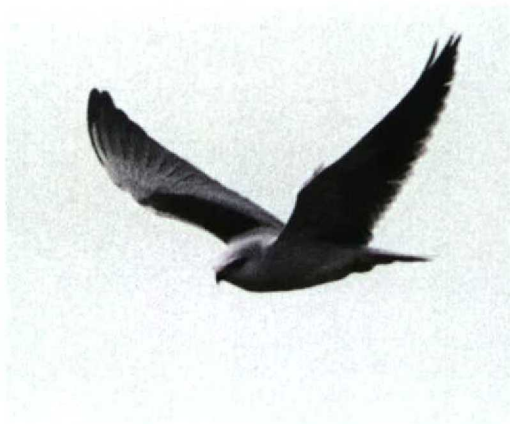
59 Grijs Wouw / Black-shouldered Kite Elanus caeruleus , adult, De Cocksdorp, Texel, Noord-Holland 30 maart 1998 (René van Rossum)

De laatste jaren is het aantal gevallen van Ross' Meeuw in Nederland sterk toegenomen; er zijn er nu