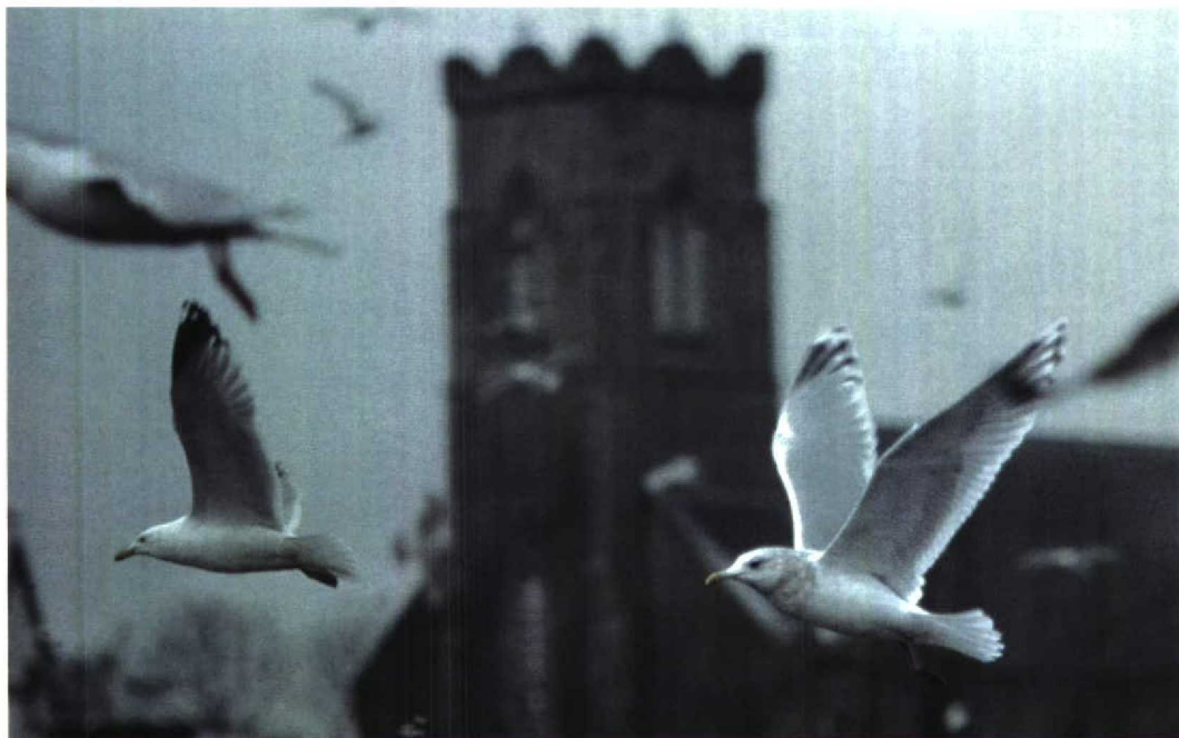
43 Thayer's Gull / Thayers Meeuw Larus glaucooides thayeri , adult, Killybegs, Donegal, Ireland, February 1998