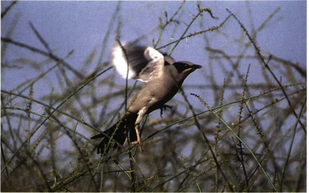
45 Grey Hypocolius / Zijdestaart Hypocolius ampelinus , Eilat, Israel, 7 April 1998 (Kris De Rouck)