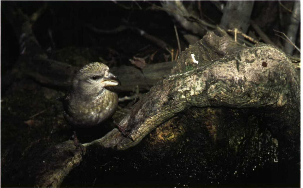
54 Grote Kruisbek / Parrot Crossbill Loxia pytyopsittacus , vrouwtje, Kennemerduinen, Noord-Holland, 13 februari 1998