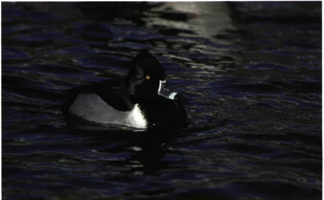
42 Ring-necked Duck / Ringsnaveleend Aythya collaris , Reykjavík, Iceland, 3 March 1998 (Gunnar Hallgrímsson)