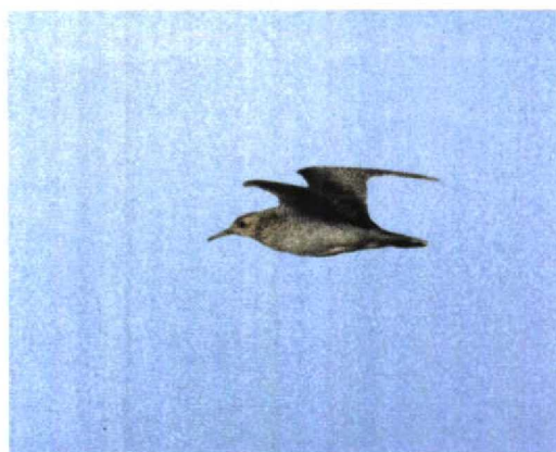
31-32 Bartrams Rooter / Upland Sandpiper Bartramia longicauda , Maasvlakte, Zuid-Holland, 28 oktober 1995 (René Pop)

periode eind augustus tot november de broedgebieden verlaat en overwintert op de pampa's van centraal Zuid-Amerika, met name van Zuid-Brazilië tot Zuid-Argentinië. In het centrum van zijn verspreidingsgebied is het één van de meest algemene steltlopers, maar in het oostelijke deel is hij schaars en neemt hij bovendien in aantal af. Tijdens de trektijd wordt de soort vooral gezien op akkers, ruige graslanden en velden met kort gras, zoals vliegvelden en golfbanen (Hayman et al 1986).