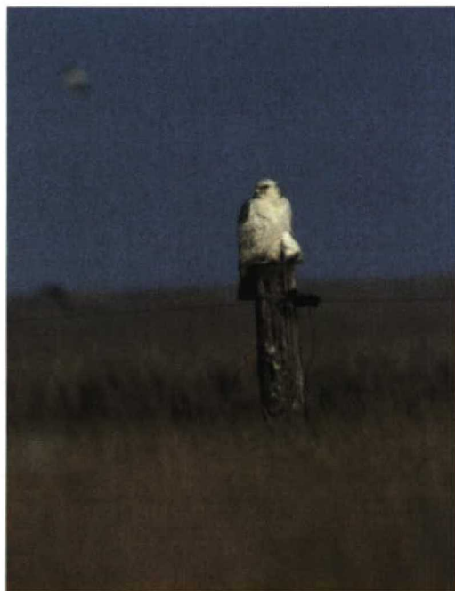
50-51 Giervalk / Gyr Falcon Falco rusticolus , onvolwassen, Schiermonnikoog, Friesland, 27 maart 1998 (Arnoud B van den Berg)

Holland, zag er als volgt uit: op 1 februari op de Ouderkerkerplas, op 2 februari op het Nieuwe Diep, op 3 en 8 februari weer op de Ouderkerkerplas, op 11 en 12 februari op het Kleine Nieuwe Diep en op 14 februari opnieuw op de Ouderkerkerplas. Het maximale aantal Ijseenden Clangula hyemalis langs de Brouwersdam, Zuid-Holland/Zeeland, bedroeg slechts zes op 6 februari. Amerikaanse Smienten Mareca americana verbleven van 26 tot 29 maart nabij Spaarndam, Noord-Holland, en op 27 maart in de Lauwersmeer, Groningen. Op 25 februari werden minimaal 200 Roodkeelduikers Gavia stellata geteld aan de buitenzijde van de Brouwersdam. Binnenlandwaarnemingen van Parelduikers G. arctica waren er van 29 januari tot 8 februari op de Nedereindse Plas bij IJsselstein, Utrecht, van 6 tot 11 februari ten oosten van Drachten, Friesland, van 15 tot 17 februari te Utrecht, Utrecht, en op 14 maart bij de Clauscentrale te Maasbracht, Limburg. Eén tot twee Ijsduikers G. immer verbleven in februari nog langs de Brouwersdam. Noordse Stormvogels Fulmarus glacialis waren spaarzaam; langsvliegende werden gezien op 8 maart bij Westkapelle, Zeeland, en op 18 maart bij Scheveningen, Zuid-Holland. Een onvolwassen Kuifaalscholver Stictocorbo aristotelis zwom van 16 tot 19 maart tussen de havenhoofden bij Scheveningen. Tot in maart werden Kleine Zilverreigers Egretta garzetta waargenomen in de Millingerwaard, Gelderland, en twee bij het Veerse