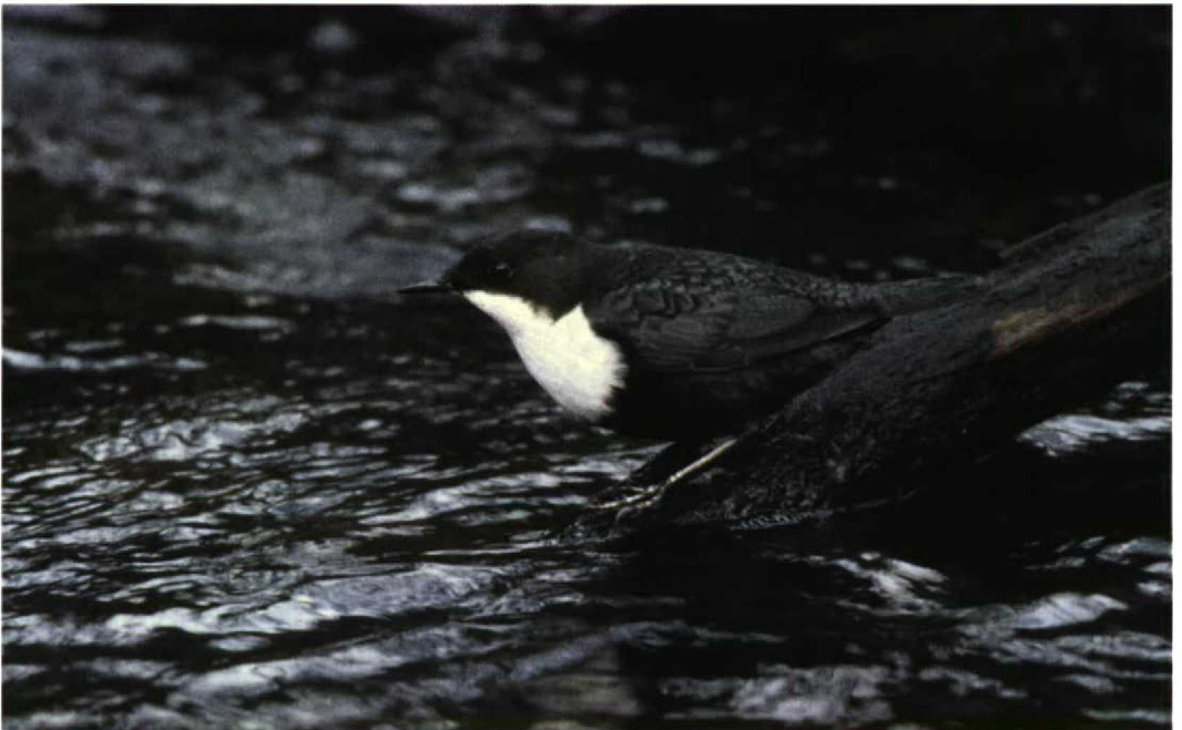
55 Waterspreeuw / Dipper Cinclus cinclus , Hierdense Beek, Gelderland, 21 januari 1998 (Wim Smeets)