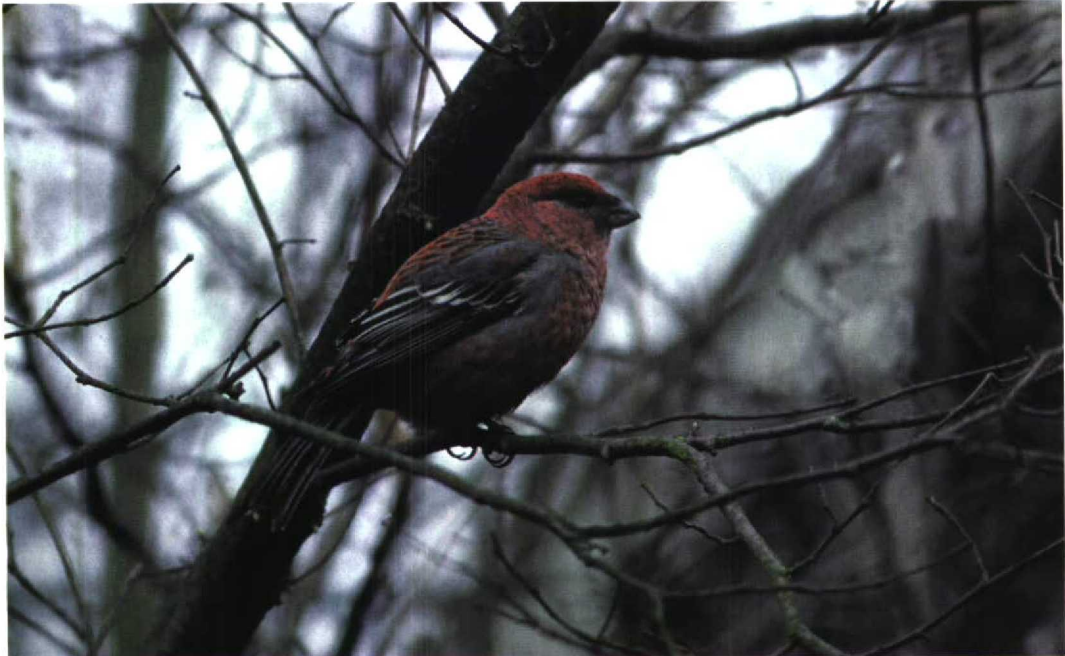
36 Haakbek / Pine Grosbeak Pinicola enucleator , Melissant, Zuid-Holland, 24 maart 1996 (Gertjan de Zoete)