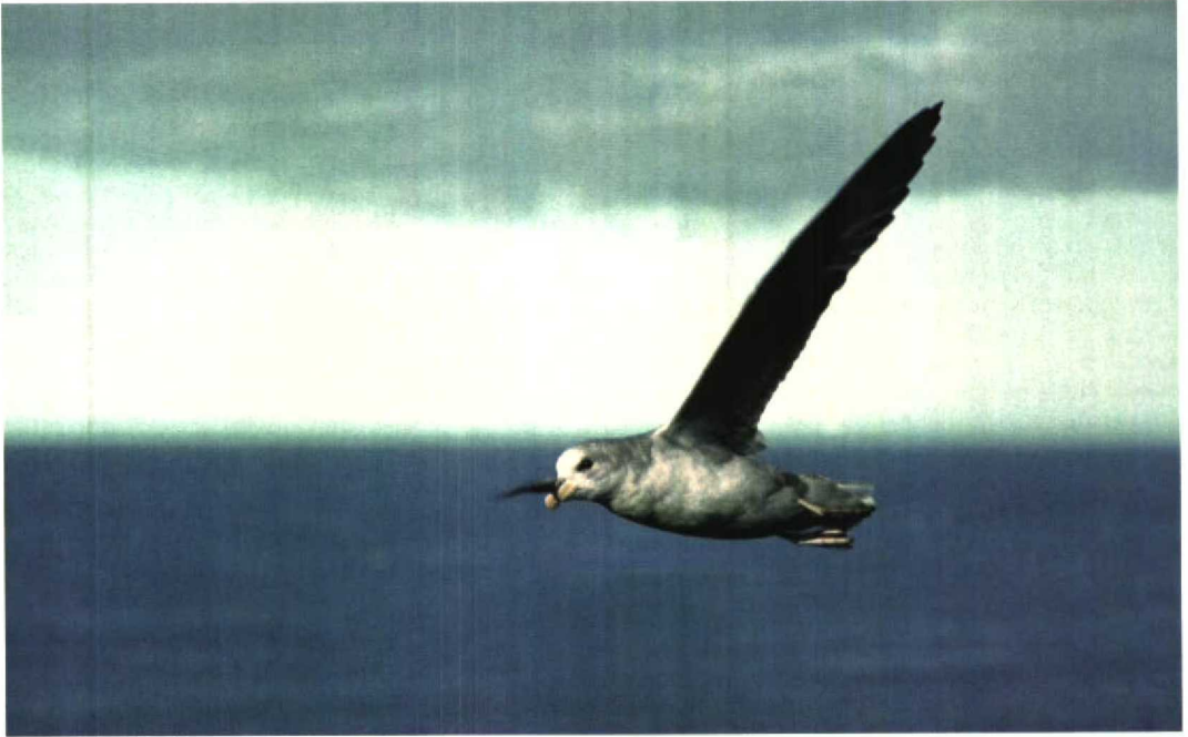
34 Fulmar / Noordse Stormvogel Fulmarus glacialis , 'double dark' morph, Sörhamna, Björnøya, Norway, 12 July 1980 (Jan Andries van Franeker)