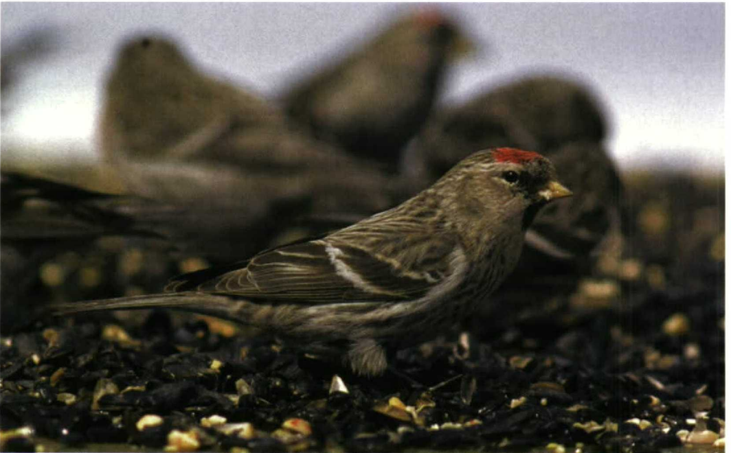
232 Grote Barmsijs / Mealy Redpoll Carduelis flammea flammea , Tomkins County, New York, USA, 14 March 1998