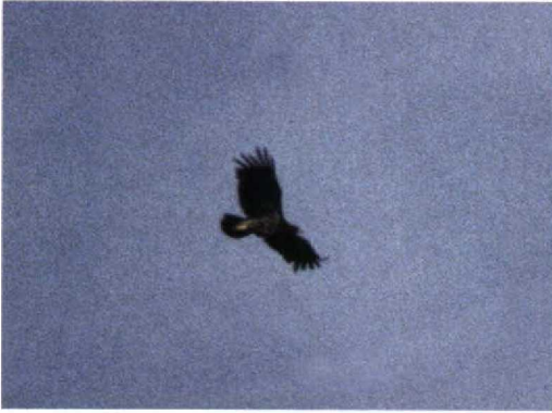
240 Bastaardarend / Spotted Eagle Aquila clanga , Lauwersmeer, Groningen, 29 augustus 1997 (Jaap van 't Hof)