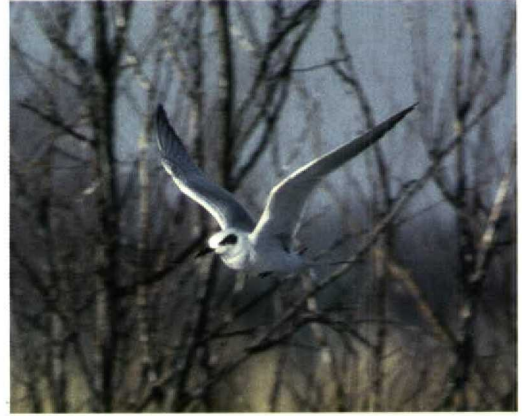
242-243 Forsters Stern / Forster's Tern Sterna forsteri , eerste-winter, Kinderdijk, Zuid-Holland, 5 januari 1995

grijs, lichter dan vleugel. Onderdelen wit. VLEUGEL Dekveren, hand- en armpennen grijs getekend. Tertiaals met donker centrum. STAART Buitenste pennen donker, kleur overige pennen lichtgrijs.