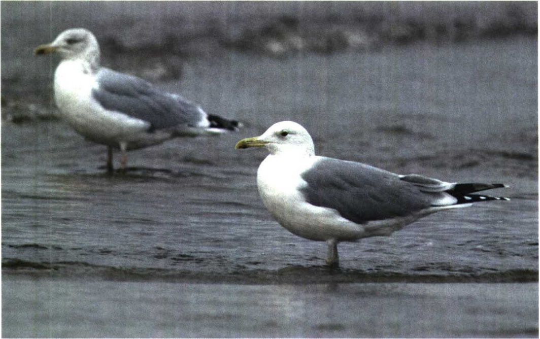
273 Pontische Meeuw / Pontic Gull Larus cachinnans cachinnans , adult (rechts) en Zilvermeeuw / Herring Gull L. argentatus , adult, Katwijk aan Zee, Zuid-Holland, 7 november 1998 (René van Rossum)