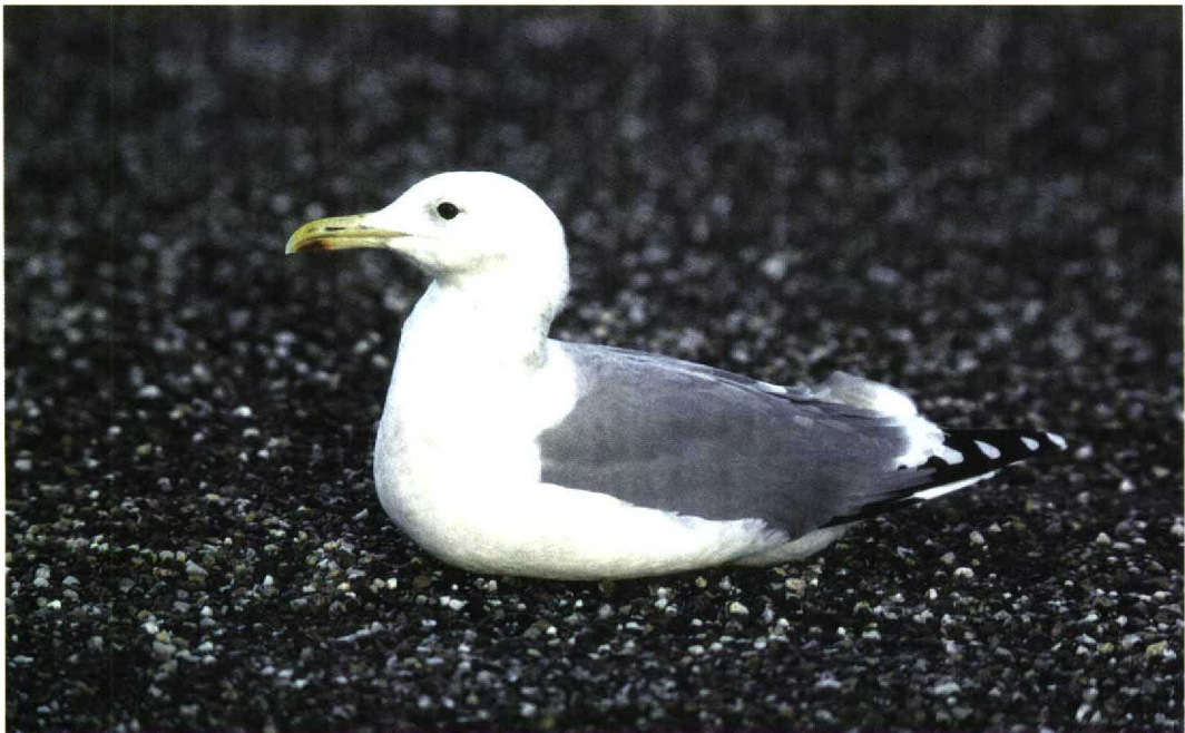
274 Pontische Meeuw / Pontic Gull Larus cachinnans cachinnans , adult, Brouwersdam, Zuid-Holland, 26 oktober 1998 (Norman van Swelm)