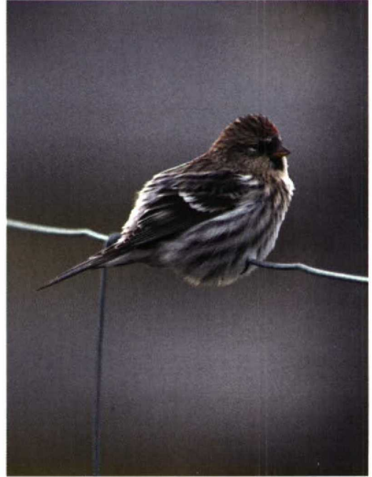
220 NW Redpoll / NW-Barmsijs Carduelis flammea rostrata/islandica , Fair Isle, Shetland, Scotland, September 1997 (Tim Loseby). This individual shows to perfection triple striping on flanks. Otherwise, fairly typical individual although with rather restricted buff wash to throat and face 221 NW Redpoll / NW-Barmsijs Carduelis flammea rostrata/islandica , Fair Isle, Shetland, Scotland, September 1997 (Tim Loseby). As plate 220 but this individual with stronger and more extensive buff on throat 222 NW Redpoll / NW-Barmsijs Carduelis flammea rostrata/islandica , Fair Isle, Shetland, Scotland, September 1996 (Roger Riddington). One of most obvious of NW Redpolls. Huge, with deep brown mantle, dark rich buff on head and strongly marked flanks