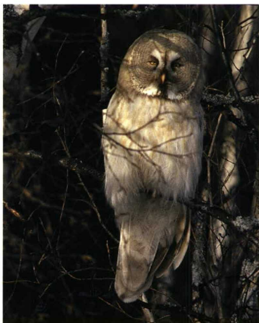
249-250 Leucistic Great Grey Owl / Laplanduil Strix nebulosa , Oulu, Finland, March 1998 (Jari Peltomäki)