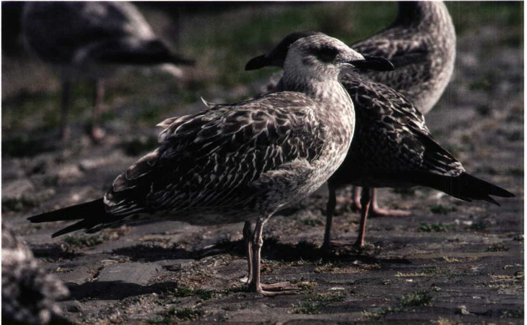
251 Yellow-legged Gull / Geelpootmeeuw Larus michahellis , juvenile moulting to first-winter plumage, Scheveningen, Zuid-Holland, Netherlands, 18 August 1998

The whitish head with dark eye-mask is also typical for Yellow-legged Gull; in juvenile Lesser Black-backed Gull, the head is usually not as pale but instead finely streaked with brown. The mystery bird also shows the rather unmarked whitish vent and belly of Yellow-legged, with dark streaks and vermiculations largely restricted to the flanks and breast(-sides). The underparts of Lesser Black-backed are normally darker and more heavily patterned, although they become paler during the winter. The identification of a first-year Yellow-legged can often be clinched most easily in flight, when it typically shows a rather narrow, but well demarcated dark tail-band (broader in Lesser Black-backed), contrastingly white, almost unmarked uppertail-coverts and rump (more patterned in Lesser Black-backed) and slightly paler inner primaries (absent in Lesser Black-backed).