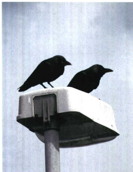
247 Huiskraai / House Crow Corvus splendens , eerstejaars, Hoek van Holland, Zuid-Holland, 6 september 1997 248 Huiskraaien / House Crows Corvus splendens , adult (rechts) en juveniel, Hoek van Holland, Zuid-Holland, 23 juli 1998

Ebels & Westerlaken 1996). De jonge vogels betekenden de vierde en vijfde Huiskraai voor Nederland en zijn als zodanig door de Commissie Dwaalgasten Nederlandse Avifauna (CDNA) aanvaard. Het dichtstbijzijnde broedgebied bevindt zich te Suez, Egypte (Madge & Burn 1993).