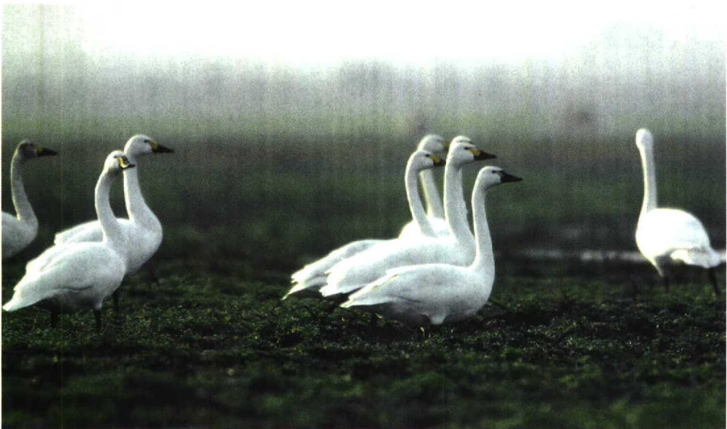
238 Fluitzwaan / Whistling Swan Cygnus columbianus met Kleine Zwanen / Bewick's Swans C bewickii , Anloo, Drenthe, december 1997 (Jan van Holten)

Vanaf het begin was duidelijk dat bij de determinatie slechts twee soorten in aanmerking kwamen: Kleine Zwaan of Fluitzwaan. Trompetzwaan C buccinator (uit Noord-Amerika en nooit in Europa vastgesteld) is groter met een veel grotere snavel zonder geel; Wilde Zwaan is eveneens groter en heeft veel meer geel op de snavel (Königstedt & Barthel 1995). De hoeveelheid geel op de snavel is in feite het enige betrouwbare kenmerk om Fluitzwaan van Kleine Zwaan te onderscheiden (Evans & Sladen 1980, Patten & Heindel 1994). Het is echter een moeilijk ken-