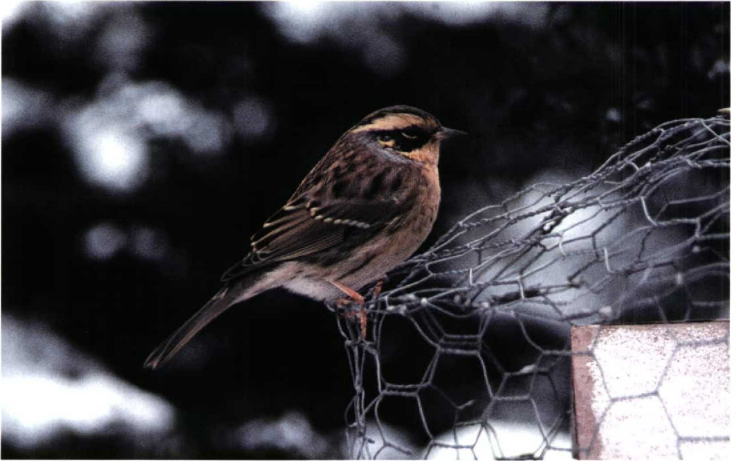
265 Siberian Accentor / Bergheggenmus Prunella montanella , Kerava, Helsinki, Finland, December 1998