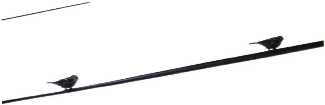
223 NW Redpoll / NW-Barmsijs Carduelis flammea rostrata/islandica and Common Chaffinch / Vink Fringilla coelebs in profile, Donegal, Ireland, September 1997. Both birds at same distance from camera! Shows striking size and bulk of many NW Redpolls

the end of September but in late October there was a smaller secondary arrival. Sightings were again daily between 19 and 28 October, with a peak of at least four on 21 October. During September, almost all redpolls present on Fair Isle were NW Redpolls. There were no sightings of Mealy Redpolls during the month but up to two Lesser Redpolls were seen. The situation was more complex in October when Mealy, Lesser and NW Redpolls were all present on some days. At this time, a few redpolls were not identified to taxon.