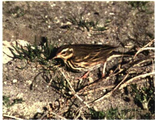
259 Surf Scoter / Brilzee-eend Melanitta perspicillata , first-winter female, Ouessant, Finistère, France, 26 October 1998 260 Pied-billed Grebe / Dikbekkuut Podilymbus podiceps , Bryher, Scilly, England, October 1998 261 Ruby-crowned Kinglet / Roodkroonhaan Regulus calendula , Vestmannaeyjar, Iceland, 11 October 1998 262 Olive-backed Pipit / Siberische Boompieper Anthus hodgsoni , Zeebrugge, West-Vlaanderen, Belgium, 6 November 1998

ber, a first-winter Bonaparte's Gull L. philadelphia on Pico on 11 November (fourth record), and Ring-billed Gulls L. delawarensis at Faja Grande, Flores, on 8 November (one first-winter), at Lajes do Pico, Pico, on 10 November (one first-winter), and on Terceira on 16-19 November (at least four first-winters and an adult). In France, a first-winter Laughing Gull was seen at Noirmoutier, Vendée, on 31 October and 18 November. In the north-eastern USA, an influx of Franklin's Gulls L. pipixcan followed a storm from the Plains in the second week of November; for instance, dozens were seen around Cape May, New Jersey, possibly the species' best showing ever in this part of the world. The third Audouin's Gull L. audouinii for Switzerland was a first-winter at Lac Léman on 9 September (the bird was also reported for 6 September on the French side of the lake). An alleged American Herring Gull L. smithsonianus at Scheveningen, Zuid-Holland, the Netherlands,