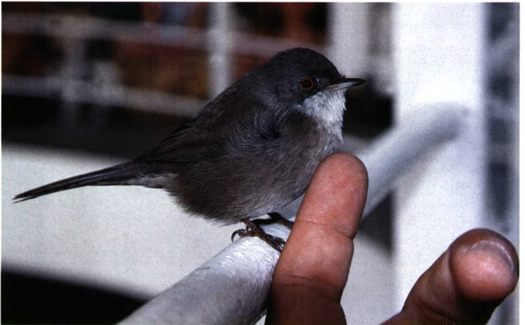
264 Sardinian Warbler / Kleine Zwartkop Sylvia melanocephala , Atlantic Ocean, off Morocco, 28 October 1998