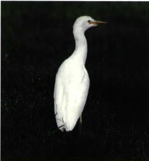
267 Koereiger / Cattle Egret Bubulcus ibis , De Putten, Camperduin, Noord-Holland, november 1998