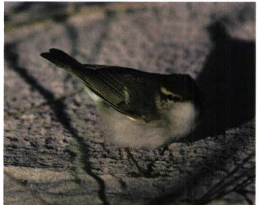
246 Noordse Boszanger / Arctic Warbler Phylloscopus borealis , Terschelling, Friesland, 2 oktober 1996

GEDRAG Veel bewegend op duinzand. Soms omhoog kruipend in helm. Wanneer vliegend, dan slechts over korte afstand, en laag blijvend. Benaderbaar tot op 1 m. Tijdens bewegen vaak omhoog kijkend en soms staart omhoog houdend.