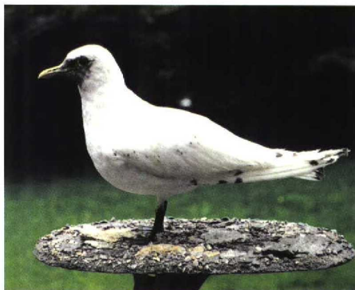
236 Ivoormeeuw / Ivory Gull Pagophila eburnea , eerste-zomer, Sankt Peter-Ording, Schleswig-Holstein, Duitsland, 24 mei 1997 237 Ivoormeeuw / Ivory Gull Pagophila eburnea , eerste-zomer (dood gevonden te Langeneß, Schleswig-Holstein, Duitsland, 9 juni 1997), Ludwig Nissen-Haus, Husum, Schleswig-Holstein, Duitsland, 28 augustus 1998

de zwarte poten en het formaat als een gedrongen zware Stormmeeuw met de brede, spits toelopende vleugels past uitsluitend op een onvolwassen Ivoormeeuw. De zwarte vlekjes in het verenkleed en de donkere vlek op de kop wijzen op een tweede-kalenderjaarovogel. Het vrijwel ontbreken van zwarte vlekjes op het lichaam duidt op een vogel in eerste zomerkleed (Grant 1982, Cramp & Simmons 1983). De kop was nog erg donker en mogelijk moest de kopruï van eerste winterkleed naar eerste zomerkleed nog worden voltooid (cf Grant 1982). Het ontbreken van één of twee staartpennen in het midden van de staart zou kunnen duiden op rui van eerste zomerkleed naar tweede winterkleed (Grant 1982, Cramp & Simmons 1983).