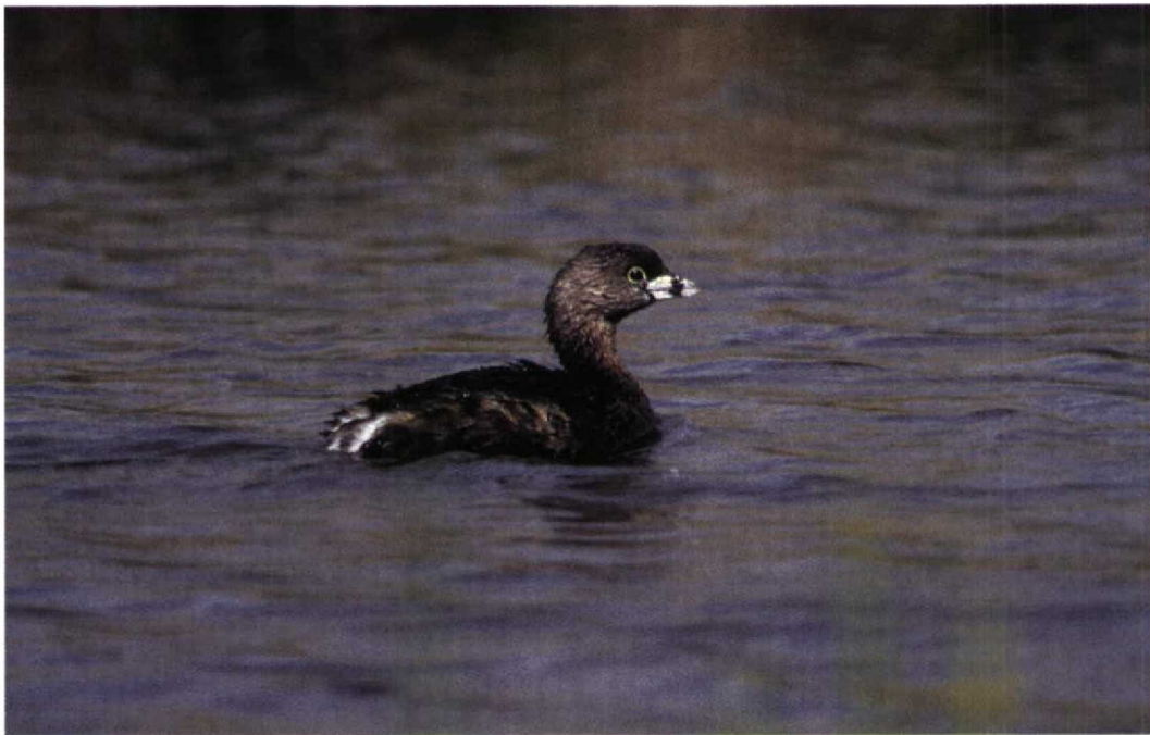
233-234 Dikbekfuut / Pied-billed Grebe Podilymbus podiceps , Akersloot, Noord-Holland, 21 april 1997 (René Pop)