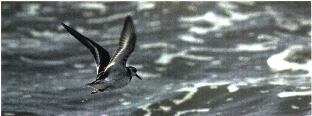
268 IJdsduiker / Great Northern Diver Gavia immer , Helmond, Noord-Brabant, 22 november 1998 269 Kuifaalscholver / Shag Stictocarbo aristotelis , Vijfhoek, Diemen, Noord-Holland, 12 november 1998 270 Zwarte Zeekoet Cephus grylle , eerste-winter, Brouwersdam, Zeeland, 28 november 1998 271 Siberische Tjiftjaf / Siberian Chiffchaff Phylloscopus collybita tristis , Park Zestienhoven, Rotterdam, Zuid-Holland, 27 november 1998 272 Rosse Franjepoot / Grey Phalarope Phalaropus fulicaria , Katwijk aan Zee, Zuid-Holland, 30 oktober 1998