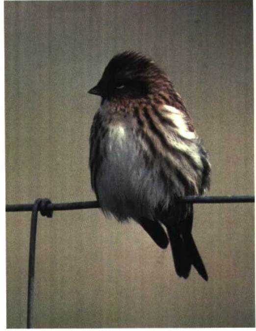
229 NW Redpoll / NW-Barmsijs Carduelis flammæ rostrata/islandica (left) and Lesser Redpoll / Kleine Barmsijs C. cabaret , Fair Isle, Shetland, Scotland, October 1997 230 NW Redpoll / NW-Barmsijs Carduelis flammæ rostrata/islandica , Fair Isle, Shetland, Scotland, September 1989

However, this feature is too variable to be an important identification character on its own.