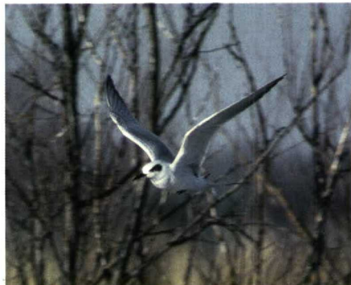
242-243 Forsters Stern / Forster's Tern Sterna forsteri , eerste-winter, Kinderdijk, Zuid-Holland, 5 januari 1995

grijs, lichter dan vleugel. Onderdelen wit. VLEUGEL Dekveren, hand- en armpennen grijs getekend. Tertiaals met donker centrum. STAART Buitenste pennen donker, kleur overige pennen lichtgrijs.