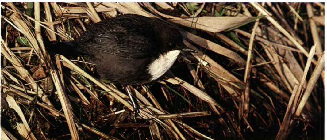
275 Waterspreeuw / Dipper Cinclus cinclus , Mariëndal, Den Helder, Noord-Holland, 21 november 1998

BIJENETERS TOT GORZEN Op 3 oktober werd een overvliegende Bijeneter Merops apiaster gemeld van de Maasvlakte. De Hop Upupa epops van Alkmaar, Noord-Holland, bleef daar tot 5 oktober. Op 6 oktober vloog er één langs het Westduinpark. Draaihalzen Jynx torquilla werden gezien op 10 oktober bij Den Oever en op 11 oktober op Vlieland, Friesland. Er was een melding van een Kortteenleeuwerik Calandrella brachydactyla op 13 oktober op de Slikken van de Heen, Noord-Brabant. 29 Grote Piepers Anthus richardi werden geteld tot 14 november maar voornamelijk in de eerste twee decaden van oktober. Hieronder bevonden zich zeven op 9 oktober ter plaatse bij Hoek van Holland, Zuid-Holland, en vijf tussen 31 oktober en 2