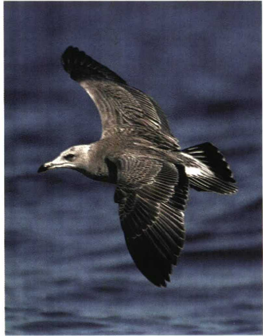
254 Red-flanked Bluetail / Blauwstaart Tarsiger cyanurus , adult female, Llobregat delta, Catalunya, Spain, 17 November 1998 ( Ricard Gutiérrez ) 255 Audouin's Gull / Audouins Meeuw Larus audouinii , first-winter, Lac Léman, Switzerland, 9 September 1998 ( Lionel Maumary ) 256 Rose-breasted Grosbeak / Roodborstkardinaal Pheucticus ludovicianus , first-winter male, Bryher, Scilly, England, October 1998 ( Nigel Bean ) 257 American Robin / Roodborstlijster Turdus migratorius , first-winter male, St Agnes, Scilly, England, October 1998 ( Nigel Bean )