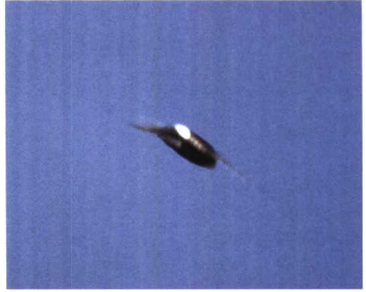
244 Nest occupied by White-rumped Swift / Kaffergierzwaluw Apus caffer nestlings, Mina de São Domingos, Alentejo, Portugal, 30 July 1995 (C C Moore). Nest presumed to be originally that of Red-rumped Swallow Hirundo daurica 245 White-rumped Swift / Kaffergierzwaluw Apus caffer , Mina de São Domingos, Alentejo, Portugal, 30 July 1995 (C C Moore)

to the nest immediately elicited 30 seconds of whinnying nestling sounds, not unlike nestlings of Lesser Kestrel Falco naumanni . Unfortunately, the area was not visited again until November, when no birds were seen. In 1996 and 1997, a pair nested again, once at the original site and once c 500 m away, again in similar circumstances and again apparently arriving late at the breeding site. On 4 October 1997, two birds in presumed juvenile plumage (faintly frosted tips of remiges, duller black plumage and a more conspicuously pale chin, compared with the blue-black plumage, fully black primaries and duller chin patch of adults) were seen nearby.