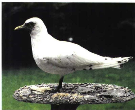
236 Ivoormeeuw / Ivory Gull Pagophila eburnea , eerste-zomer, Sankt Peter-Ording, Schleswig-Holstein, Duitsland, 24 mei 1997 237 Ivoormeeuw / Ivory Gull Pagophila eburnea , eerste-zomer (dood gevonden te Langeneß, Schleswig-Holstein, Duitsland, 9 juni 1997), Ludwig Nissen-Haus, Husum, Schleswig-Holstein, Duitsland, 28 augustus 1998

de zwarte poten en het formaat als een gedrongen zware Stormmeeuw met de brede, spits toelopende vleugels past uitsluitend op een onvolwassen Ivoormeeuw. De zwarte vlekjes in het verenkleed en de donkere vlek op de kop wijzen op een tweede-kalenderjaarvogel. Het vrijwel ontbreken van zwarte vlekjes op het lichaam duidt op een vogel in eerste zomerkleed (Grant 1982, Cramp & Simmons 1983). De kop was nog erg donker en mogelijk moest de kopruï van eerste winterkleed naar eerste zomerkleed nog worden voltooid (cf Grant 1982). Het ontbreken van één of twee staartpennen in het midden van de staart zou kunnen duiden op rui van eerste zomerkleed naar tweede winterkleed (Grant 1982, Cramp & Simmons 1983).