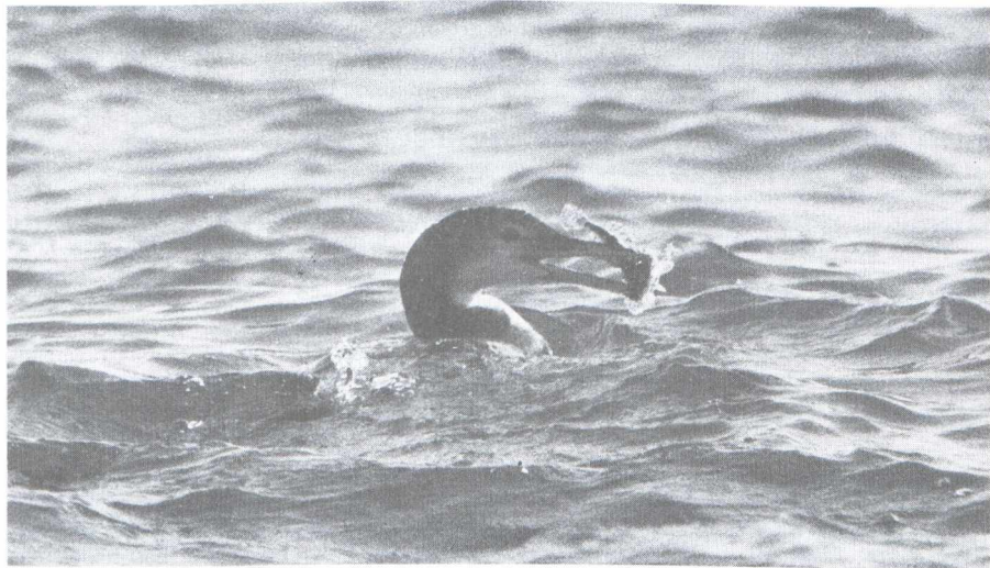
51. Raadselvogel 3/Mystery bird 3. Oplossing in het volgende nummer/Solution in the next issue

Gerald J. Oreel, Postbus 51273, 1007 EG Amsterdam