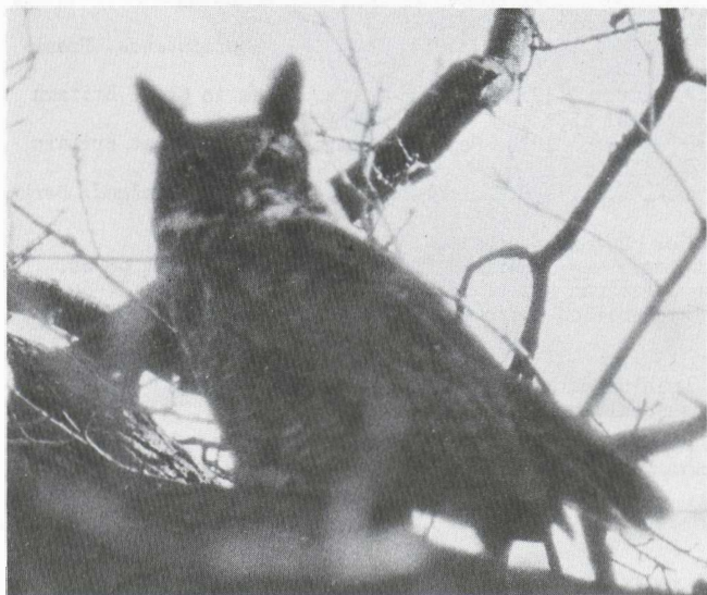
43. Amerikaanse Oehoe/Great Horned Owl Bubo virginianus , Waterland, Velsen (NH), april 1976 (Jan Mulder)

Vanaf 1973 of 1974 bevindt zich een mannetje Amerikaanse Oehoe Bubo virginianus op het landgoed 'Waterland' bij Velsen (NH) (cf. van den Berg 1979). Omdat ik meer over zijn herkomst wilde weten, heb ik bij alle voor het publiek toegankelijke dierentuinen en vogelparken geïnformeerd of het wel eens was voorgekomen dat een Amerikaanse Oehoe uit hun collectie was ontsnapt. De meeste antwoorden dat dit nooit was gebeurd. Een uitzondering vormde het dierenpark te Wassenaar (ZH). In de zomer van 1972 is hier namelijk een Amerikaanse Oehoe ontsnapt. De vogel is nog enige dagen in de bomen van het dierenpark waargenomen; daarna is hij niet meer gezien. Het lijkt mij heel goed mogelijk dat dit de Amerikaanse Oehoe is die zich bij Velsen bevindt. Tot dusver werd algemeen aangenomen dat de betrokken vogel een wild exemplaar was dat met een schip uit Noord-Amerika was meegekomen (cf. van den Berg l.c.).