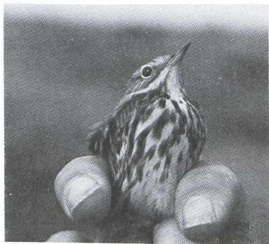
50. Red-throated Pipit Anthus cervinus , Ringstation Castricum, Castricum (Noord-Holland), 28 September 1979 (Ruud Luntz)

The identification of Red-throated Pipit in non-breeding plumage is far more difficult than generally realised. This is mainly due to the great variability of Meadow Pipit. In the course of 10 years I trapped and handled Meadow Pipits with: heavily streaked upperparts; creamy V-marks on mantle; streaked rump; heavily streaked underparts; streaked under tail-coverts; wing-length corresponding to the largest Tree Pipit Anthus trivialis ; and wing formula well inside that of Red-throated Pipit (there seems to be a tendency for the wing formula to resemble that of Red-throated Pipit more closely as the wing length increases).