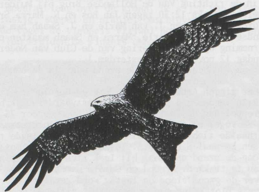
Zwarte Wouw/Black Kite Milvus migrans (Eric van Ommen)

"Dutch Birding zal ongetwijfeld in een behoefte voorzien. Het is jammer dat echter geen samenwerking met de NOU bestaat omdat deze uitgave wellicht Limosa concurrentie aan kan doen. In elk geval zullen de kundige medewerkers voor een goede inhoud van het blad borg kunnen staan. Overigens hopen wij op een goede samenwerking en wensen jullie veel succes."