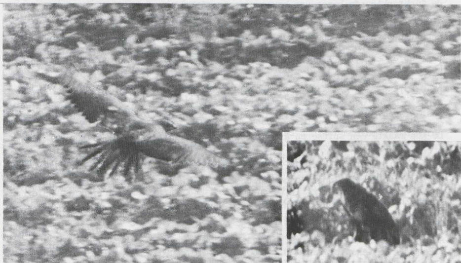
Fig. 23 Havikarend/Bonelli's Eagle Hieraetus fasciatus Oostvaardersdijk, Zuidelijk Flevoland (ZIJP) 7 november 1978 (Jan Bos)

De vogel vloog meestal laag over de grond. De wijze van vliegen werd als krachtig, roeiend, rustig, soepel en stabiel omschreven. Hij zeilde zo nu en dan. Hierbij hield de vogel de vleugels vrijwel horizontaal, af en toe iets omhoog. Tijdens het zeilen krulden de vingers omhoog.