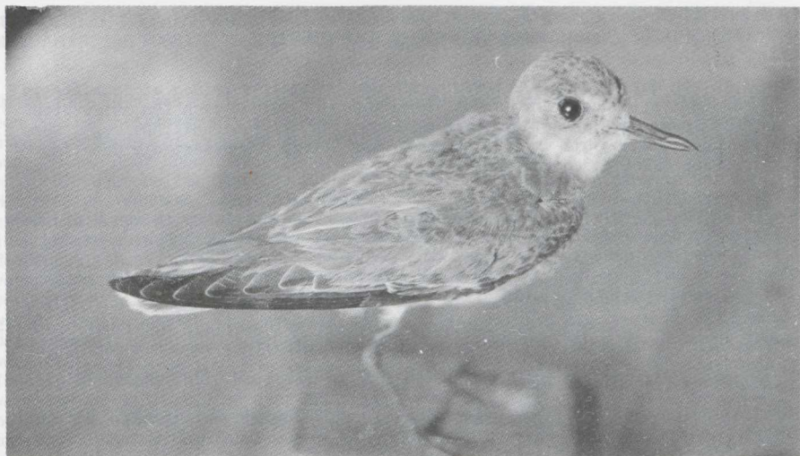
Fig. 26 Woestijnplevier/Greater Sand Plover Charadrius leschenaultii Grevelingen 27 Museum, Dreischor (Z) 11 augustus 1979