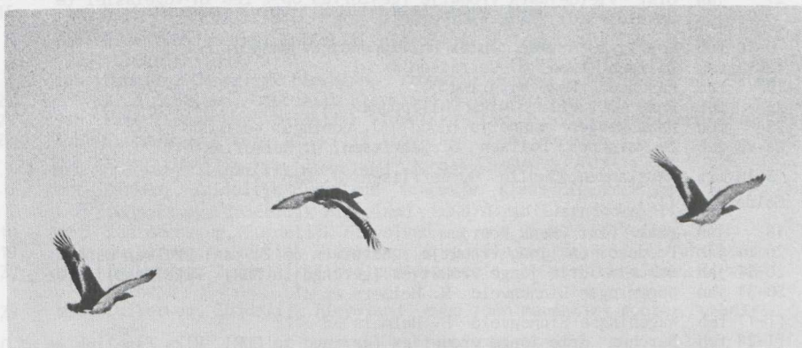
Fig. 24 Grote Trap/Great Bustard Otis tarda De Vaart, Zuidelijk Flevoland (ZIJP) januari 1979 ( Ulco Glimmerveen )

In de winter van 1978/79 bezocht een groot aantal Grote Trappen Otis tarda Nederland. De eerste waarnemingen waren op 6 januari en de laatste waarneming was op 2 april. Er zijn mogelijk 108 verschillende vogels vastgesteld. Dit aantal ligt aanzienlijk boven dat van de laatste grote invasie in de winter van 1969/1970 toen mogelijk 34 verschillende exemplaren werden vastgesteld (cf. Tekke 1971). In België werden slechts drie Grote Trappen waargenomen. Hier was de soort sedert de winter van 1962/63 overigens niet meer vastgesteld (Paul Herroelen pers.med. ).