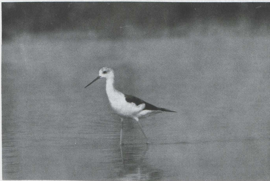
Fig. 36 Steltkluut/Black-winged Stilt Himantopus himantopus Kraanvogelweg, Zuidelijk Flevoland (ZIJP) 28 juli 1979

Van 5 tot en met 8 juli bevond zich een onvolwassen Kraanvogel/Crane Grus grus in de omgeving van Antwerpen (Antwerpen, België).