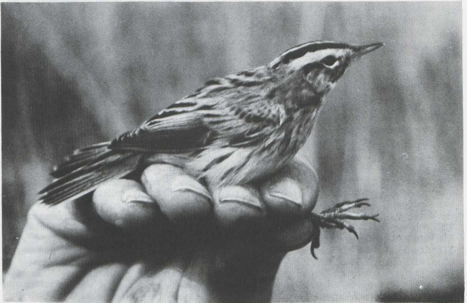
Fig. 32 Raadselvogel 2/Mystery bird 2

Kees (C.) S. Roselaar, Stuartstraat 105, 1815 BR Alkmaar