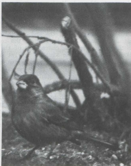
Fig.34 Mexicaanse Roodmus/House Finch Carpodacus mexicanus Lange Nieuwstraat, 35 IJmuiden (NH) 4 februari 1979 (Henk van der Pol)

De Mexicaanse Roodmus broedt in westelijk Noord-Amerika en zijn verspreidingsgebied strekt zich uit van British Columbia (Canada) in het noorden tot Oaxaca (Mexico) in het zuiden. De soort is in 1940 op Long Island (New York) ingevoerd. Sindsdien heeft hij zich van hieruit sterk uitgebreid en is hij in New York en andere staten in het oosten van de USA een algemene vogel geworden (Bock & Lepthien 1976, Bull 1964, Elliott & Arbib 1953). Bull (1964) noemt hem een "attractive addition to our avifauna" en een "melodious, tame and very adaptive species". Er zij op gewezen dat de in het oosten van de USA broedende Mexicaanse Roodmussen tot de ondersoort C. m. frontalis behoren ( American Ornithologists' Union 1957).