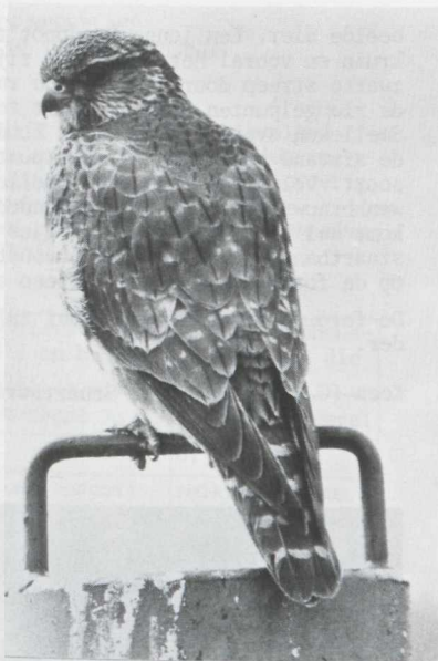
Fig. 31 Smelleken/Merlin Falco columbarius Vogelweg, Zuidelijk Flevoland (ZIJP) 4 mei 1979 (Jan Mulder)

RAADSELVOGEL 1: SMELLEKEN Falco columbarius MYSTERY BIRD 1: MERLIN Falco columbarius