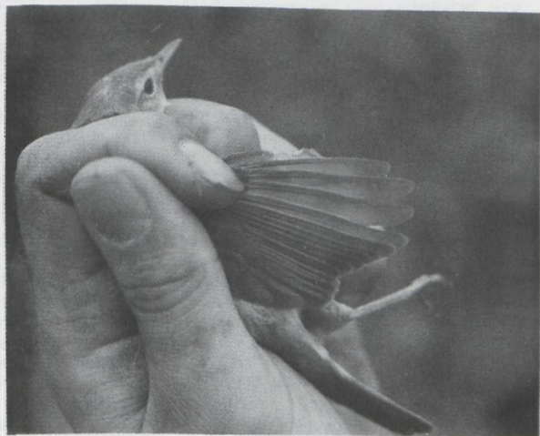
Fig. 33 Orpheusspotvogel/ Melodious Warbler Hippolais polyglotta Oostvaardersdijk, Zuidelijk Flevoland (ZIJP) 2 september 1979 (Eduard Osieck)

De Orpheusspotvogel heeft dus een kortere en vooral meer afgeronde vleugel dan de Spotvogel. Beide kenmerken zijn ook als veldkenmerk bruikbaar (cf. Wallace 1964). In het leefnet liet de vogel een roep horen die veel leek op de 'tjerr'-roep van de Winterkoning Troglodytes troglodytes . Een dergelijke roep is mij