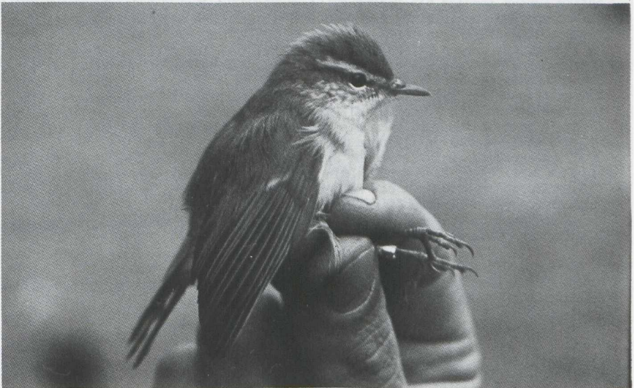
Fig. 37 Grauwe Fitis/Greenish Warbler Phylloscopus trochiloides eerste kalenderjaar vogel/first calendar year bird Castricum (NH) 11 augustus 1979 (Cock Reijnders)

De Cettis Zanger/Cetti's Warbler Cettia cetti ging dit jaar sterk achteruit en werd nog slechts op vijf plaatsen waargenomen: in de Carnisse Grienden bij IJsselmonde (ZH), bij de Steurgatsluis te Werkendam (NB), in de Braakman (Z), in Het Zwin (Z) en bij het grindgat bij Eijsden (L).