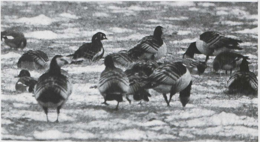
Fig. 22 Roodhalsgans/Red-breasted Goose Branta ruficollis tussen/among Brandganzen/Barnacle Geese Branta leucopsis en/and Smienten/Wigeons Anas penelope Serooskerke (Z) 18 februari 1979