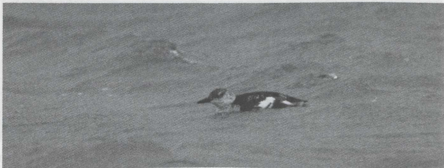
57. Black Guillemot/Zwarte Zeekoet Cepphus grylle , Brouwersdam (Zuid-Holland), 22 December 1979