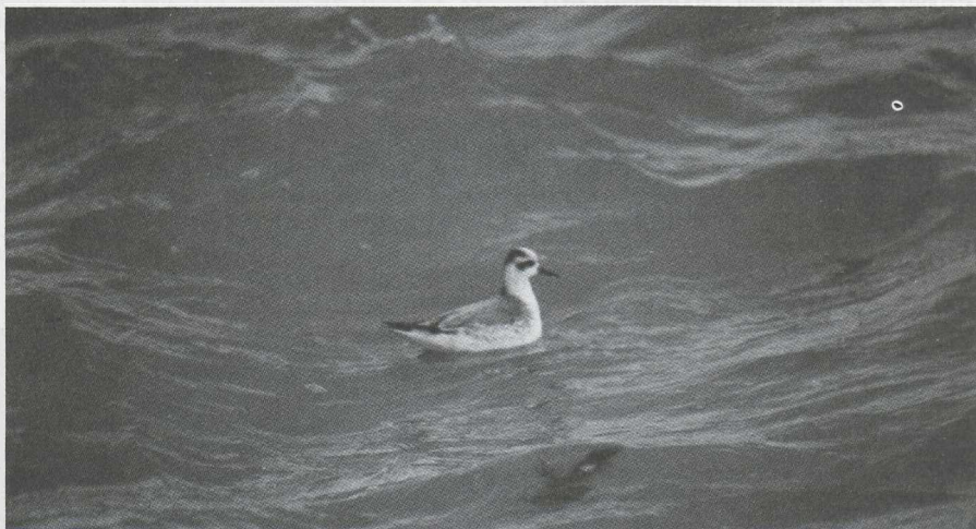
55. Grey Phalarope/Rosse Franjepoot Phalaropus fulicarius , Scheveningen (Zuid-Holland), January 1980

8 Jan Scheveningen (Zuid-Holland) 1 until 10 Jan