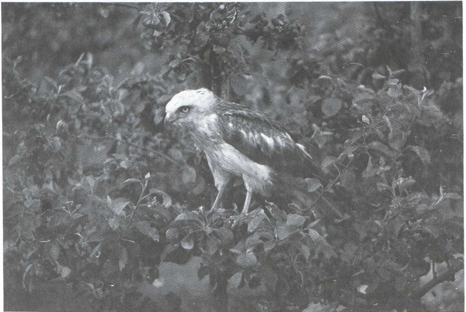
41. Slangenarend/Short-toed Eagle Circaetus gallicus , Wijdenes (NH), 2 juni 1979 (Bert Rebergen)

Bij onderzoek bleek de vogel broodmager; de darmen waren geheel leeg. Het dier had kennelijk in geen tijden iets gegeten.