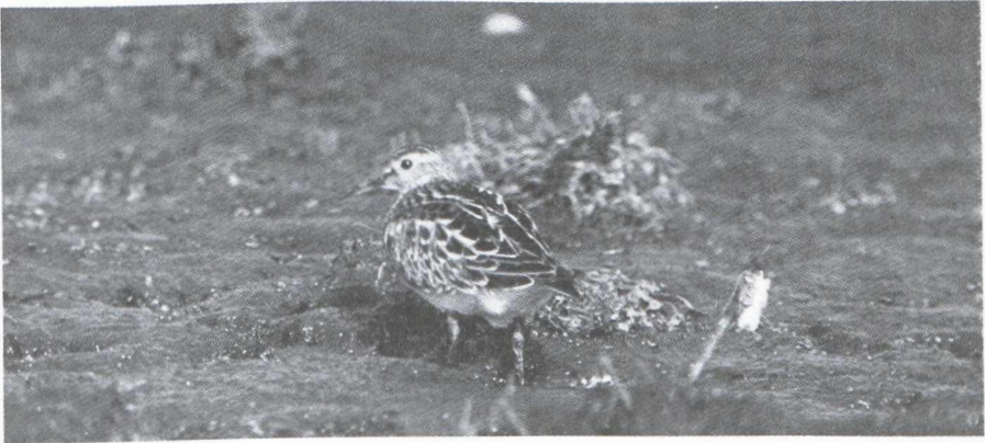
44. Amerikaanse Gestreepte Strandloper/Pectoral Sandpiper Calidris melanotos , Turnhout (Antwerpen), 10 oktober 1979

Op 6 oktober 1979 werd door R. Vermeyen te Turnhout (Antwerpen, België) een Amerikaanse Gestreepte Strandloper Calidris melanotos gedetermineerd. De vogel bleef ter plaatse tot 16 oktober zodat zeer veel veldornithologen, zowel uit België als uit Nederland, in de gelegenheid waren deze dwaalgast te komen observeren. Op 8 oktober werd de vogel geringd.