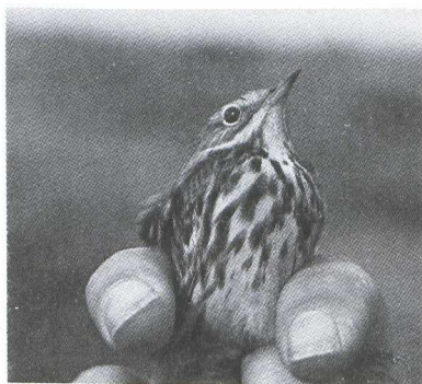
50. Red-throated Pipit Anthus cervinus , Ringstation Castricum, Castricum (Noord-Holland), 28 September 1979 (Ruud Luntz)

The identification of Red-throated Pipit in non-breeding plumage is far more difficult than generally realised. This is mainly due to the great variability of Meadow Pipit. In the course of 10 years I trapped and handled Meadow Pipits with: heavily streaked upperparts; creamy V-marks on mantle; streaked rump; heavily streaked underparts; streaked under tail-coverts; wing-length corresponding to the largest Tree Pipit Anthus trivialis ; and wing formula well inside that of Red-throated Pipit (there seems to be a tendency for the wing formula to resemble that of Red-throated Pipit more closely as the wing length increases).