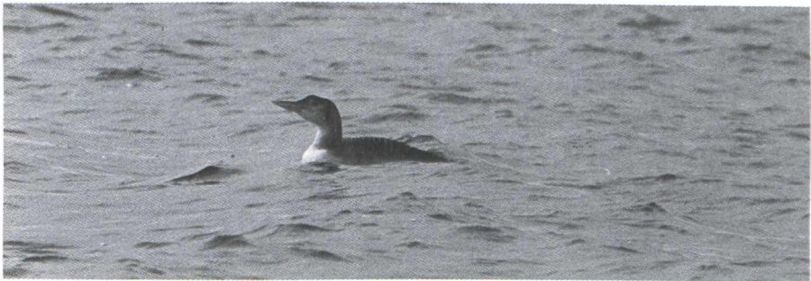
38. Geelsnavelduiker/White-billed Diver Gavia adamsii , tweede kalenderjaar, Kornwerderzand (F), 24-28 februari 1979 (Lammert Mol)

Zeker 13 gevallen hebben betrekking op vogels in eerste winterkleed. Dit in tegenstelling tot Groot-Brittannië waar van de tot en met 1973 vastgestelde gevallen (39 in totaal) slechts twee op jonge vogels betrekking hadden (Burn & Mather 1974). Dit zou erop kunnen wijzen dat eerste- en ouderejaars Geelsnavelduikers verschillende overwinteringsgebieden hebben. De meeste Britse