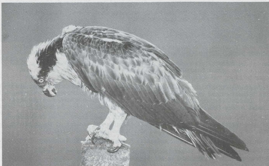
54. Osprey/Visarend Pandion haliaetus , Oostelijk Flevoland (Zuidelijke IJsselmeerpolders), 1 January 1980

There were several records of late Ospreys/Visarenden Pandion haliaetus : on 11 November at Waddenoijen (Gelderland), on 24 November at the Wieringermeer (Noord-Holland), in the beginning of December near De Plaat van Scheelhoek, Goeree (Zuid-Holland) and on 5 January at the Haringvlietdam (Zuid-Holland). Until 5 January one stayed in Oostelijk Flevoland; on that day it was trapped and brought in a bad condition to a bird hospital in Gorsseel (Gelderland).