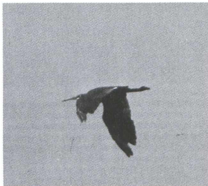
40. Westelijke Rifeiger/Western Reef Heron Egretta gularis , Camargue, Frankrijk, 27 juli 1979 (Karel Mauw)