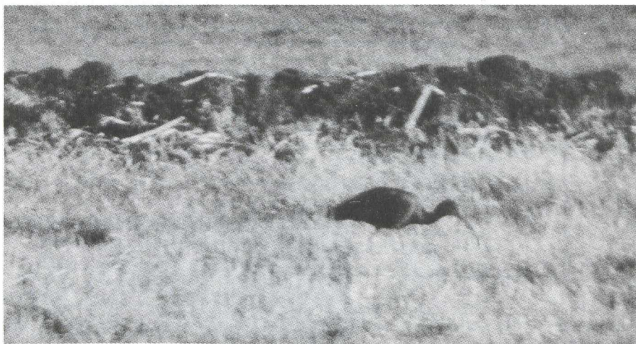
53. Glossy Ibis/Zwarte Ibis Plegadis falcinellus , Ouderkerk aan de Amstel (Noord-Holland), 20 November 1979 (Arnoud van den Berg)