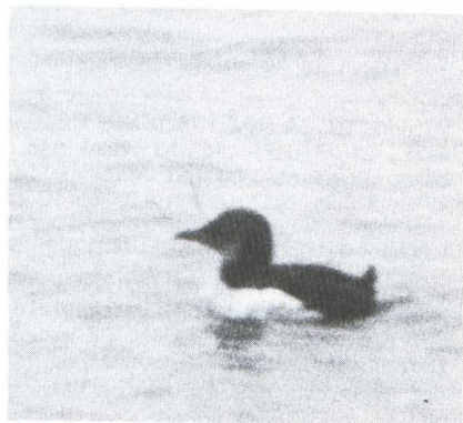
45-46. Dikbekzeekoet/Brännich's Guillemot Uria lomvia , Brouwersdam (ZH), 4 februari 1979