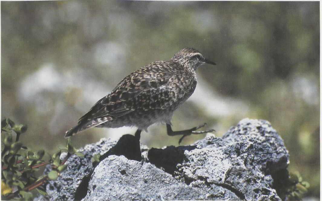
72 Tuamotu Sandpiper / Tuamotustrandloper Prosobonia cancellata , Toreatai, Tahanea, Tuamotu Islands, March 1997 (Tini & Jacob Wijkema)