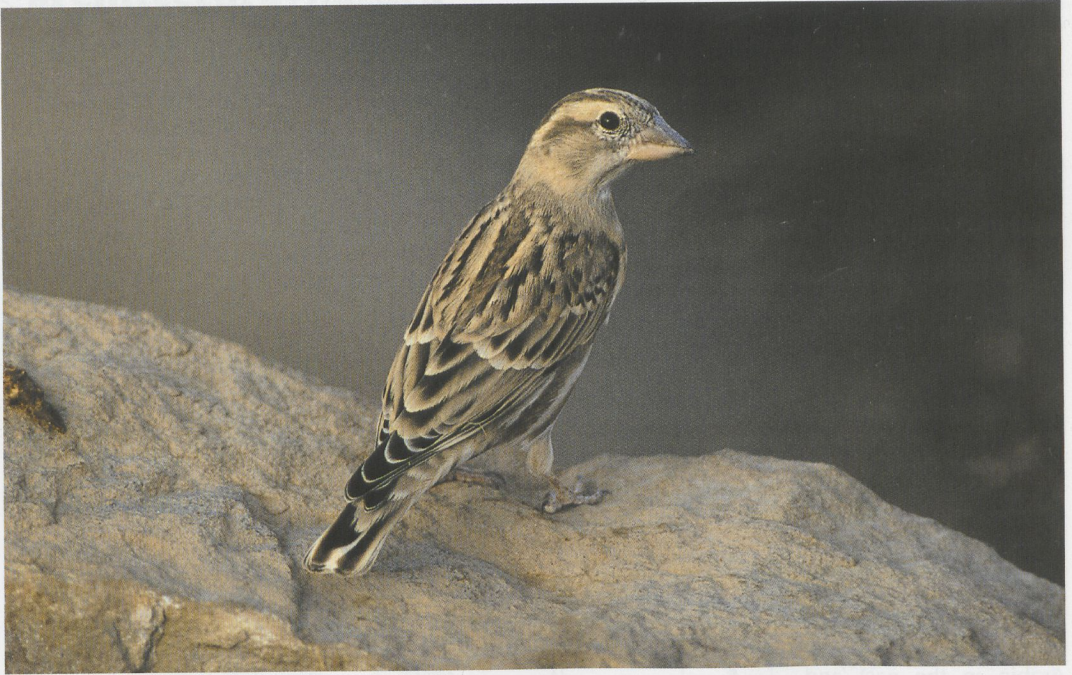
51 Rock Sparrow / Rotsmus Petronia petronia , Wadi Dana, Jordan, October 1994