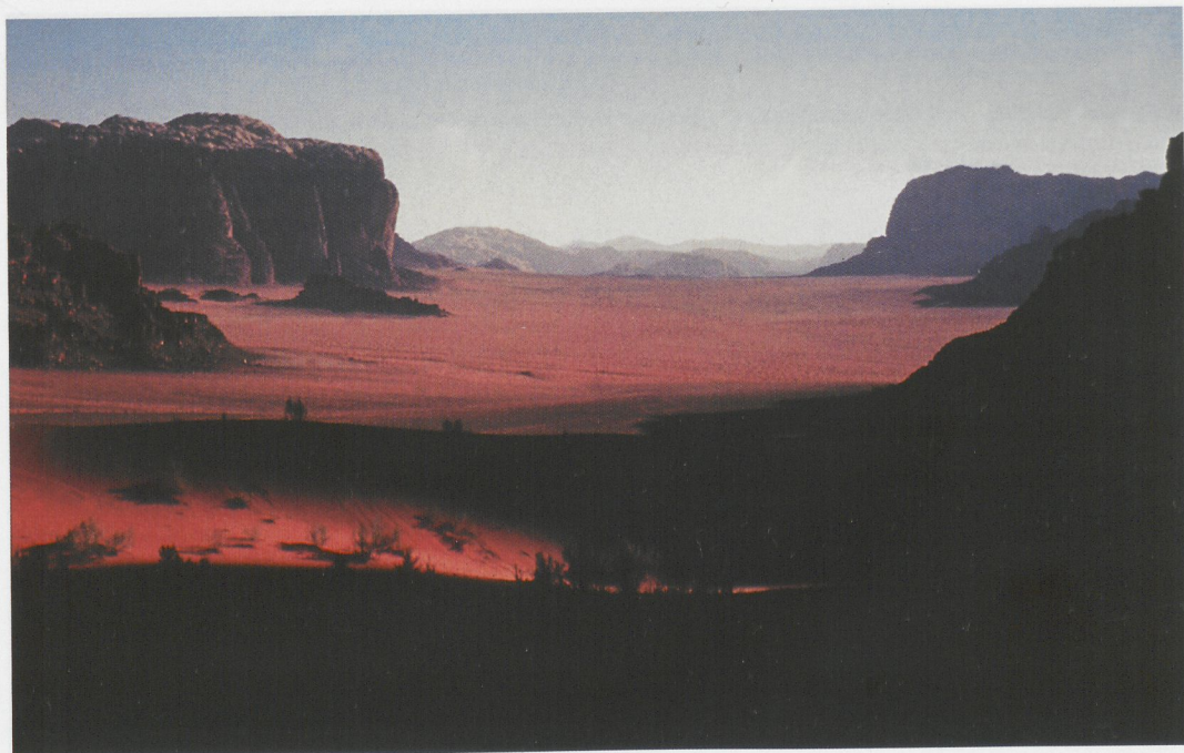
55 Wadi Umm Ishrin, Jordan, at sunset