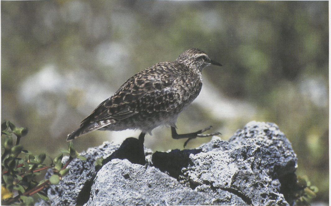
72 Tuamotu Sandpiper / Tuamotustrandloper Prosobonia cancellata , Toreatai, Tahanea, Tuamotu Islands, March 1997 (Tini & Jacob Wijkema)