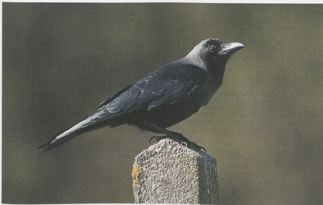
87 Huiskraai / House Crow Corvus splendens , Hoek van Holland, Zuid-Holland, 29 maart 1997 (René van Rossum)