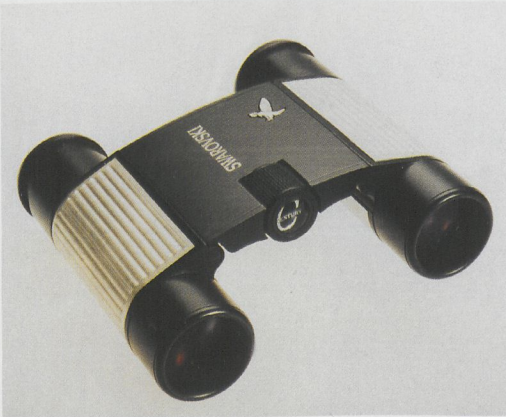
Swarovski 8x20B Century binoculars