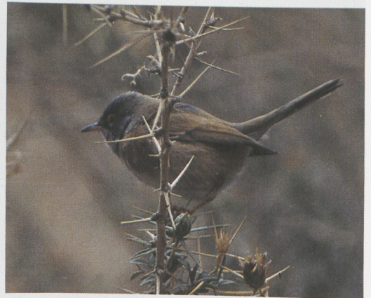
80 Isabelline Shrike / Izabelklauwier Lanius isabellinus , Siracusa, Sicily, Italy, February 1997 (Walter Silvestrini) 81 Lesser Kestrel / Kleine Torenvalk Falco naumanni , Beuvrequen, Pas-de-Calais, France, 30 March 1997 (Marc Ameels) 82 Hume's Warbler / Humes Bladkoning Phylloscopus humei , Isola della Cona, Staranzano, Gorizia, Italy, March 1997 (Maurizio Azzolin) 83 Sociable Lapwing / Steppiekievit Vanellus gregarius , Stenay, Meuse, France, 1 April 1997 (Marc Ameels) 84 Desert Sparrow / Woestijnmus Passer simplex , at nest, Erg Chebbi, Merzouga, Tafilalt, Morocco, 9 April 1997 (Arnoud B van den Berg) 85 Tristram's Warbler / Atlasgrasmus Sylvia deserticola , Gorges du Todra, Tinerhir, Morocco, 10 April 1997 (Arnoud B van den Berg)