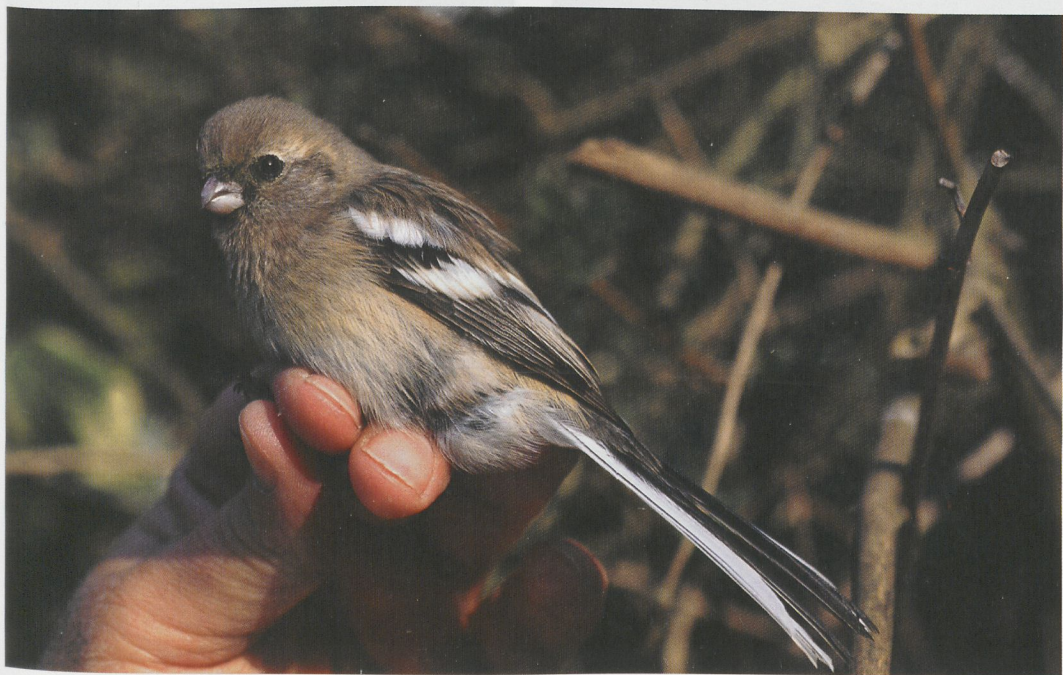
88 Langstaartroodmus / Long-tailed Rosefinch Uragus sibiricus , Bloemendaal, Noord-Holland, 10 maart 1997