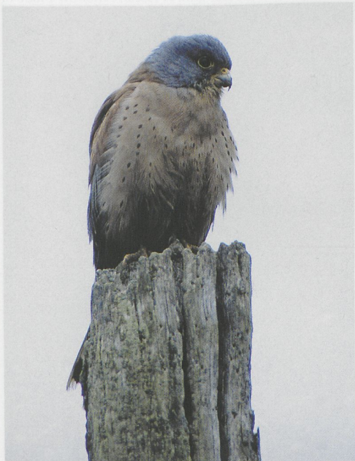
76 Lesser Kestrel / Kleine Torenvalk Falco naumanni , Beuvrequen, Pas-de-Calais, France, 26 March 1997 (Roger Tonnel)