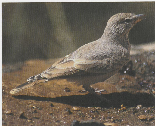
60 Desert Lark / Woestijnleeuwerik Ammomanes deserti , Wadi Dana, Jordan, October 1994