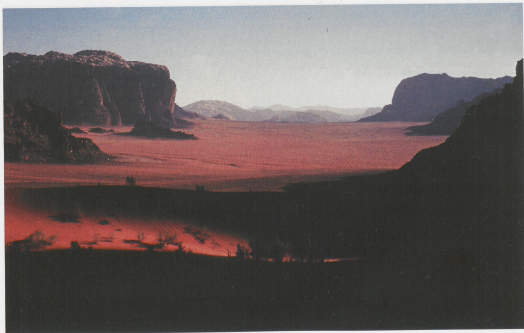
55 Wadi Umm Ishrin, Jordan, at sunset