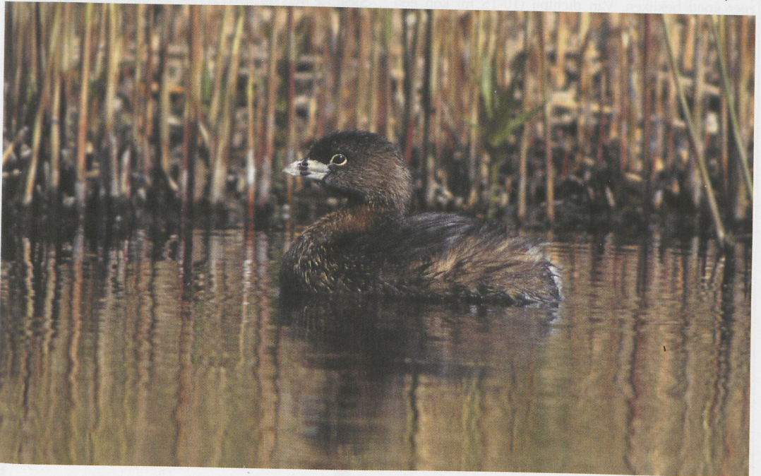
93 Dikbekfuut / Pied-billed Grebe Podilymbus podiceps , Akersloot, Noord-Holland, 21 april 1997

Rond 20:15 belde JW zijn voormalige ZMA-collega C S (Kees) Roselaar in Alkmaar, Noord-Holland, met het nieuws dat hij die middag een Dikbekfuut had gezien en dat hij bij literatuuronderzoek thuis (aan de hand van Vogels nieuw in Nederland (1990) en de laatste zes jaargangen van Dutch Birding) bemerkte had dat dit een nieuwe soort voor Nederland moest zijn. Plannen om die avond terug te gaan om een meer uitvoerige beschrijving te maken konden geen doorgang vinden. Daarom besloot CSR, ondanks de invallende schemering, een vogelaar met een auto te bellen en te bewegen om met hem te gaan zoeken. Nadat hij Klaas Eigenhuis had gebeld om het nieuws te verspreiden vond hij uiteindelijk Bert de Haan bereid om samen met diens zontje Ruben mee te gaan. Om 20:50 waren zij gedrieën ter plekke en hoewel de zon al onder was, was het nog niet erg donker. De vogel in