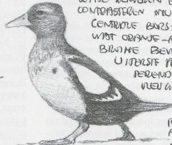
SNAREL SWIJDEND OVER HET WOOD

MANTEL EN SCHOUWERBANDEN BIJNA VOLLEDIG BIJWIJ, MET UITZONDERING VAN RESTANT VAN DE MANTEL VAN DE BRUKE MANTEL-V. (ZIE ONDER).