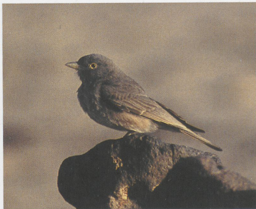
61 Dark Desert Lark / Donkere Woestijnleeuwerik Ammomanes deserti annae , As Safawi, Jordan, 9 April 1996

Hotel. In spring, migrants (herons, waders, skuas, swallows, wagtails etc) can often be seen making landfall here, whilst throughout the year seabirds fly back and forth along the Aqaba shore and around the dock area.