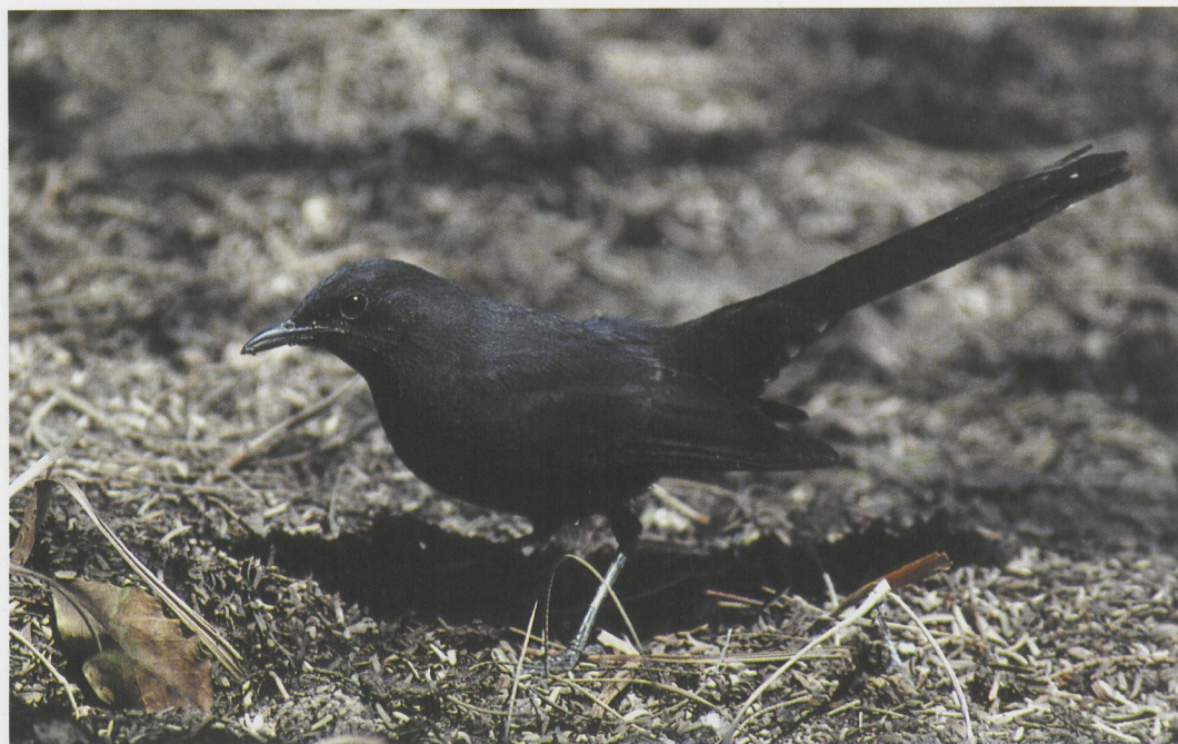
79 Black Scrub-robin / Zwarte Waaiertaart Cercotrichas podobe , Eilat, Israel, 10 April 1997 (Gabriël Schuler)