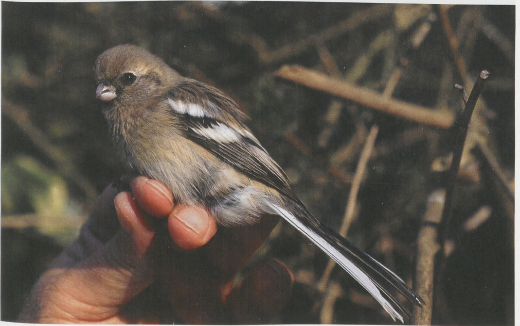
88 Langstaartroodmus / Long-tailed Rosefinch Uragus sibiricus , Bloemendaal, Noord-Holland, 10 maart 1997