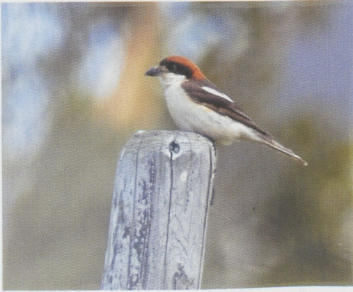
67 Balearische Roodkopklauwier / Balearic Woodchat Shrike Lanius senator badius , Voorhout, Zuid-Holland, 6 juni 1993