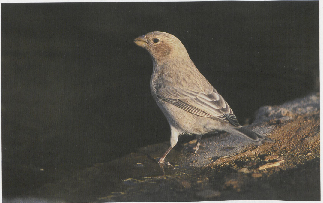
52 Sinai Rosefinch / Sinaiiroodmus Carpodacus synoicus , female, Wadi Dana, Jordan, October 1994