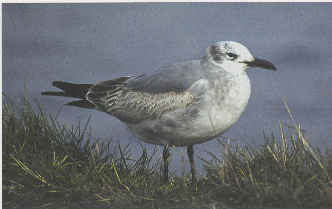
78 Laughing Gull / Lachmeeuw Larus atricilla , Newry, Down, Northern Ireland, March 1997 (Oran O'Sullivan)