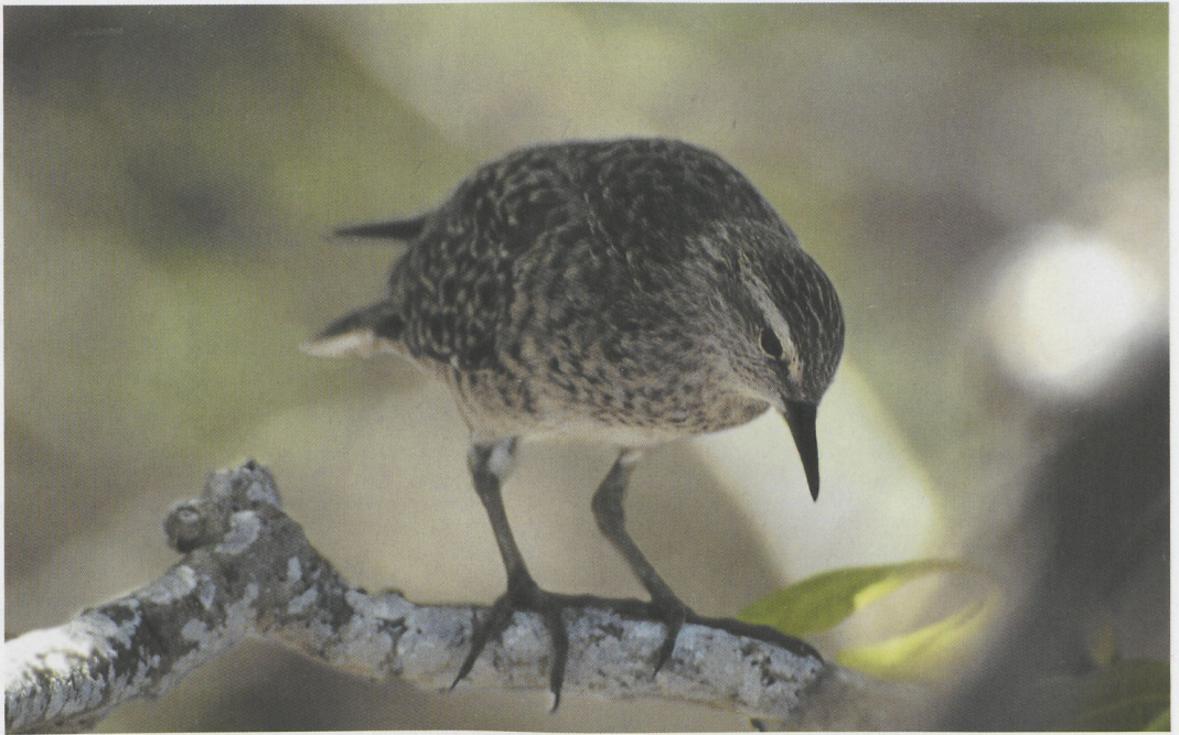
73-74 Tuamotu Sandpiper / Tuamotustrandloper Prosobonia cancellata , Toreatai, Tahanea, Tuamotu Islands, March 1997