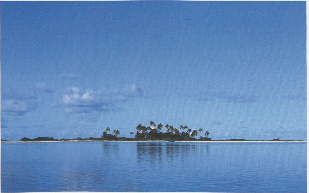
71 Noiokao, Tahanea, Tuamotu Islands, March 1997 (Tini & Jacob Wijkema)