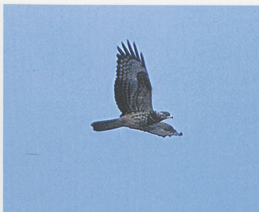
9 Honey-buzzard / Wespendif Pernis apivorus , adult female, Eilat, Israel, May 1994. Note typically brown upperparts with inconspicuously patterned remiges and brownish (not grey) head 10 Honey-buzzard / Wespendif Pernis apivorus , juvenile of pale morph, Istanbul, Turkey, 22 September 1996. Note extensively yellow cere and base of bill, darkish secondaries and sparse but bold barring to remiges and tail (compare with juvenile Steppe Buzzard Buteo buteo vulpinus in plate 7)

ed birds are scarce; only the percentage of black birds seems to remain the same.