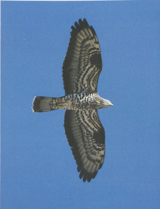
4 Honey-buzzard / Wespendif Pernis apivorus , heavily barred adult male, Eilat, Israel, May 1987 ( Hadoram Shirihai ) 5 Honey-buzzard / Wespendif Pernis apivorus , adult male of dark morph, Eilat, Israel, May 1994 ( Hadoram Shirihai ). Note grey head and distinct and broad black trailing edge of wing, both typical of adult male

Most juveniles have uniformly dark brown bodies. These brownish forms make up 85-90% of the autumn migrant juveniles in the Levant (Dick Forsman pers obs), the remainder being principally paler birds. Black juveniles, as well as those which are uniformly whitish, are rare and only constitute a few percent. This ratio between the colour morphs does not correspond with the ratio found in adults, in which uniformly colour-