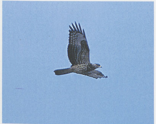
9 Honey-buzzard / Wespendif Pernis apivorus , adult female, Eilat, Israel, May 1994. Note typically brown upperparts with inconspicuously patterned remiges and brownish (not grey) head 10 Honey-buzzard / Wespendif Pernis apivorus , juvenile of pale morph, Istanbul, Turkey, 22 September 1996. Note extensively yellow cere and base of bill, darkish secondaries and sparse but bold barring to remiges and tail (compare with juvenile Steppe Buzzard Buteo buteo vulpinus in plate 7)

ed birds are scarce; only the percentage of black birds seems to remain the same.