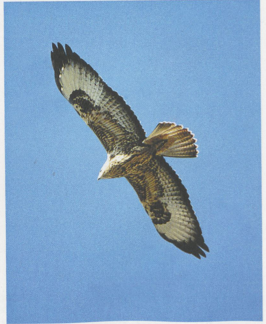
6 Honey-buzzard / Wespendif Pernis apivorus , typical adult female, Eilat, Israel, May 1994 ( Hadoram Shirihai ). Note generally dusker remiges of underwing compared with adult male, with secondaries fractionally darker than primaries and with dusker and less well-marked 'fingers'. Barring in wings and tail more evenly spaced compared with adult male 7 Steppe Buzzard / Steppebuizerd Buteo buteo vulpinus , juvenile, Chokpak, Kazakhstan, September 1993 ( Dick Forsman ). Note generally paler secondaries compared with juvenile Honey-buzzard, with finer and denser barring to tail and wing. In subspecies of Common Buzzard Buteo buteo , median coverts form pale wing-band, contrasting against more patterned lesser and greater coverts 8 Honey-buzzard / Wespendif Pernis apivorus , adult male, Eilat, Israel, May 1994 ( Hadoram Shirihai ). Note diagnostic greyish cast to upperparts with distinct trailing edge to upperwing. Note also grey head and 'clean looking' underwing with distinct barring