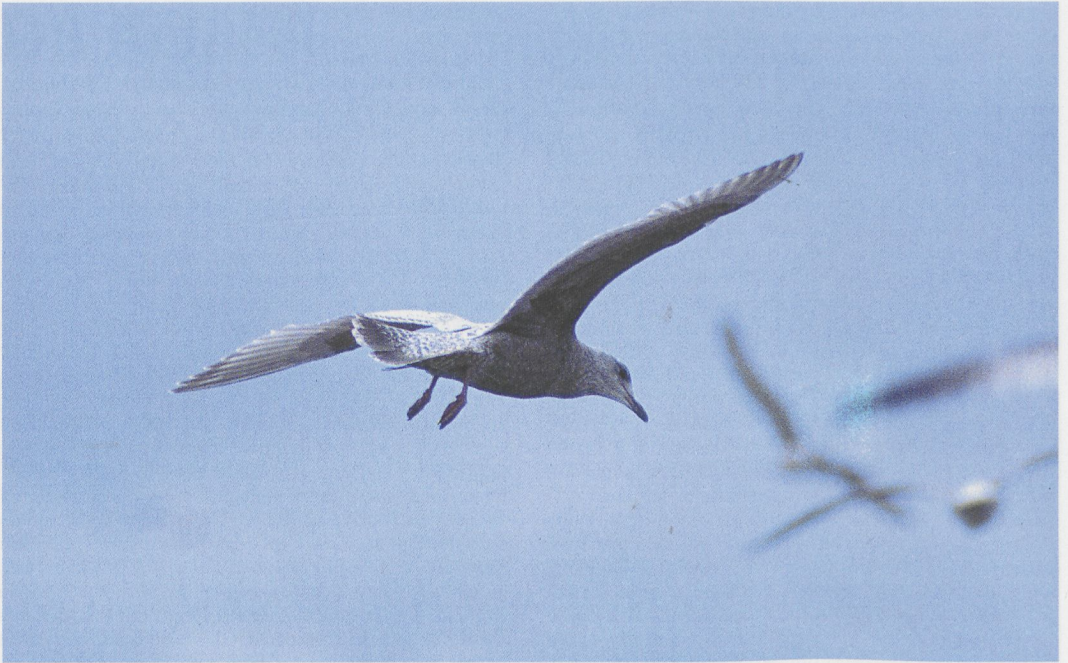
50 Thayer's Gull / Thayers Meeuw Larus (glaucoides) thayeri , first-winter, Belfast, Antrim, Northern Ireland, 1 March 1997 (Anthony McGeehan)

rest, the bird looked 'odd & unique' and differed as much from Iceland Gull as it did from Herring Gull. In many ways, it more closely resembled a small first-winter smithsonianus with frosty upperparts and unusual primaries, which were dark brown with chevron-like pale fringes. In flight, the critical features were the bird's plain and smooth tail band which covered all but the bases of the outermost tail feathers (again, like a smithsonianus : though less blackish-brown in colour). The end of the tail was tipped pale, and the uppertail coverts were closely barred: all of which emphasised the tail's dark band. Each of the outer group of primaries was dark brown (almost, but not quite as dark as in a Herring Gull) on the outer web but pale on the inner. The tips of these feathers were more extensively dark