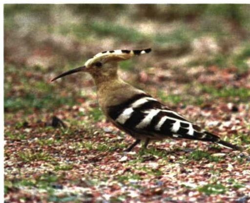
314 Witbandkruisbek / Two-barred Crossbill Loxia leucoptera , mannetje, Oranje-Nassau's Oord, Wageningen, Gelderland, 8 november 1997 315 Pallas' Boszanger / Pallas's Leaf Warbler Phylloscopus proregulus , Texel, Noord-Holland, oktober 1997 316 Lachmeeuw / Laughing Gull Larus atricilla , Groningen, Groningen, 4 oktober 1997 317 Roodkeelpieper / Red-throated Pipit Anthus cervinus , Hoorn, Terschelling, Friesland, 4 november 1997 318 Groenlandse Kolgans / Greenland White-fronted Goose Anser albifrons flavirostris , Workum, Friesland, 9 november 1997 319 Hop / Hoopoe Upupa epops , Texel, Noord-Holland, oktober 1997