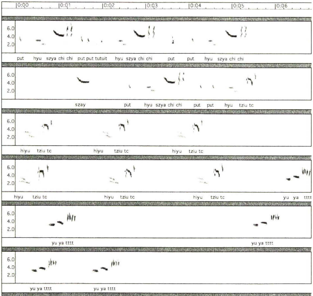
FIGUUR 1. Zang van Struikrietzanger / Blyth's Reed Warbler Acrocephalus dumetorum , Walem, Limburg, 22 juni 1996 (Arnoud B van den Berg)

de vele imitaties bij beide soorten op elkaar kan lijken, was het langzame ('slome') tempo kenmerkend voor Struikrietzanger (cf Ellis et al 1994). De determinatie werd ondersteund door kenmerken in bouw en verenkleed (cf Williamson 1968, Harvey & Porter 1984, Cramp 1992, Harris et al 1996, Jonsson 1997). De lange snavel in combinatie met vlak voorhoofd en hoge kruin en de korte handpenprojectie pasten goed op Struikrietzanger. De korte maar voor het oog opvallende wenkbrauwstreep, de overwegend uniform gekleurde bovendelen en vleugels